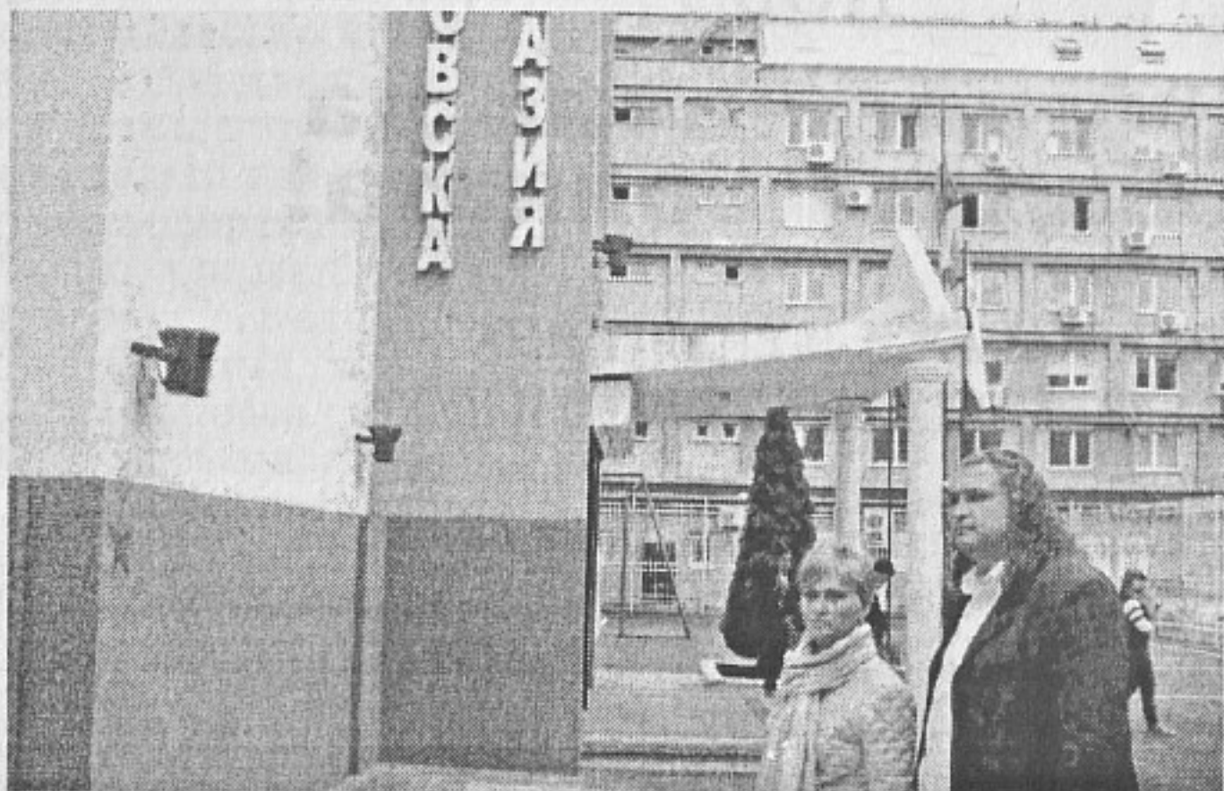
Професионалната търговска гимназия е иновирала тотално

Следва Ярослав КОЮМДЖИЕВ Асоциация “Институт за научноизследователска и мониторингова дейност в регион Евразия” - Бургас