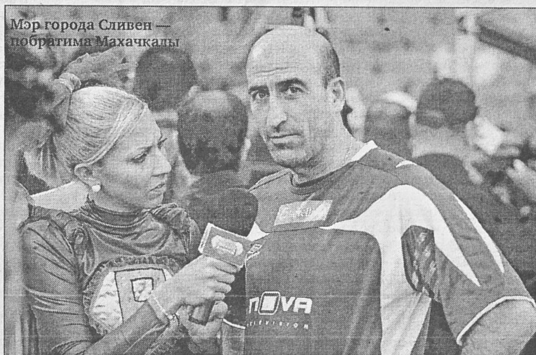
Мэр города Сливен — побратима Махачкалы