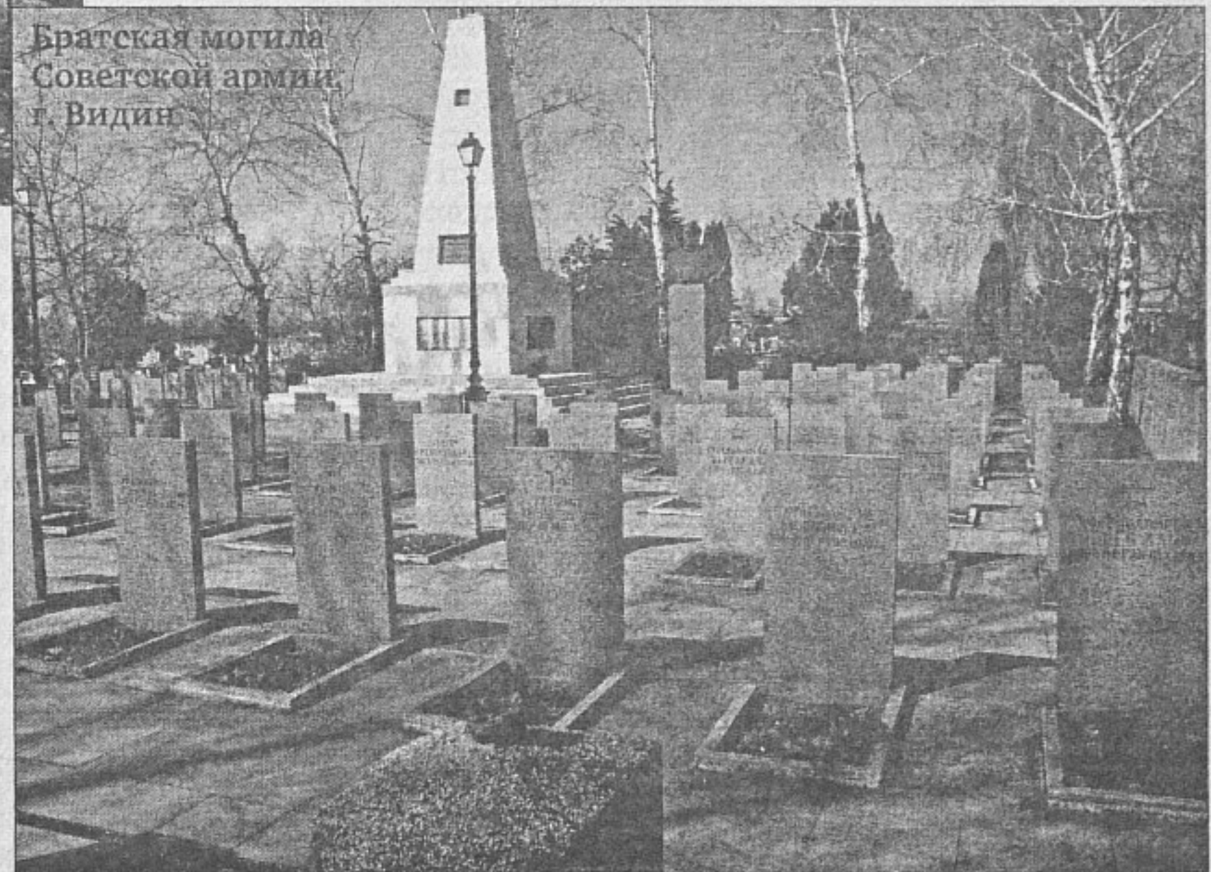
Братская могила Советской армии, г. Видин

Ярослав КОЮМДЖИЕВ, Сливен—Махачкала.