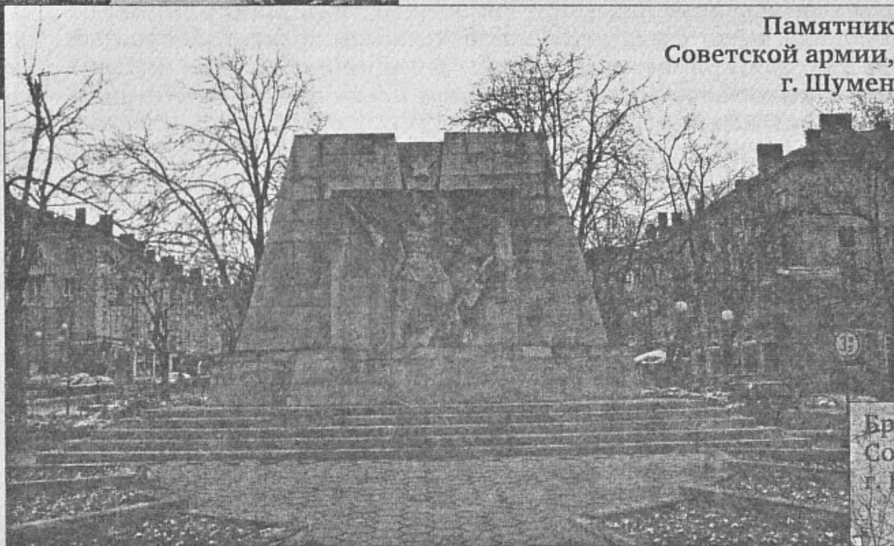
Памятник Советской армии, г. Шумен

В городе Добрич, на территории центрального городского парка расположен мемориал (10x10 м) «Слава советской Армии-освободительнице». Памятник установлен на месте, где в 1948 городе были перезахоронены воины, умершие от ран в Добричском районе. В братской могиле захоронены останки 45 солдат, 25 из которых неизвестны. Памятник входит в состав паркового комплекса с прилегающей к нему инфраструктурой: центральная аллея, по бокам которой расположены цветочные