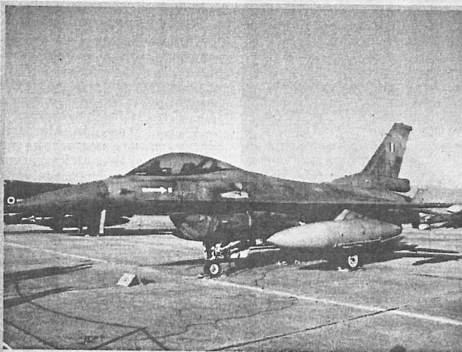
През 2007 г. Полша получи поредната партида от 4 самолета от поръчаните общо 48 самолета Ф-16 block 52.

Анализ на иранските военни сили и може ли България да се бори с тях, ако бъде въввлечена в конфликт с Иран