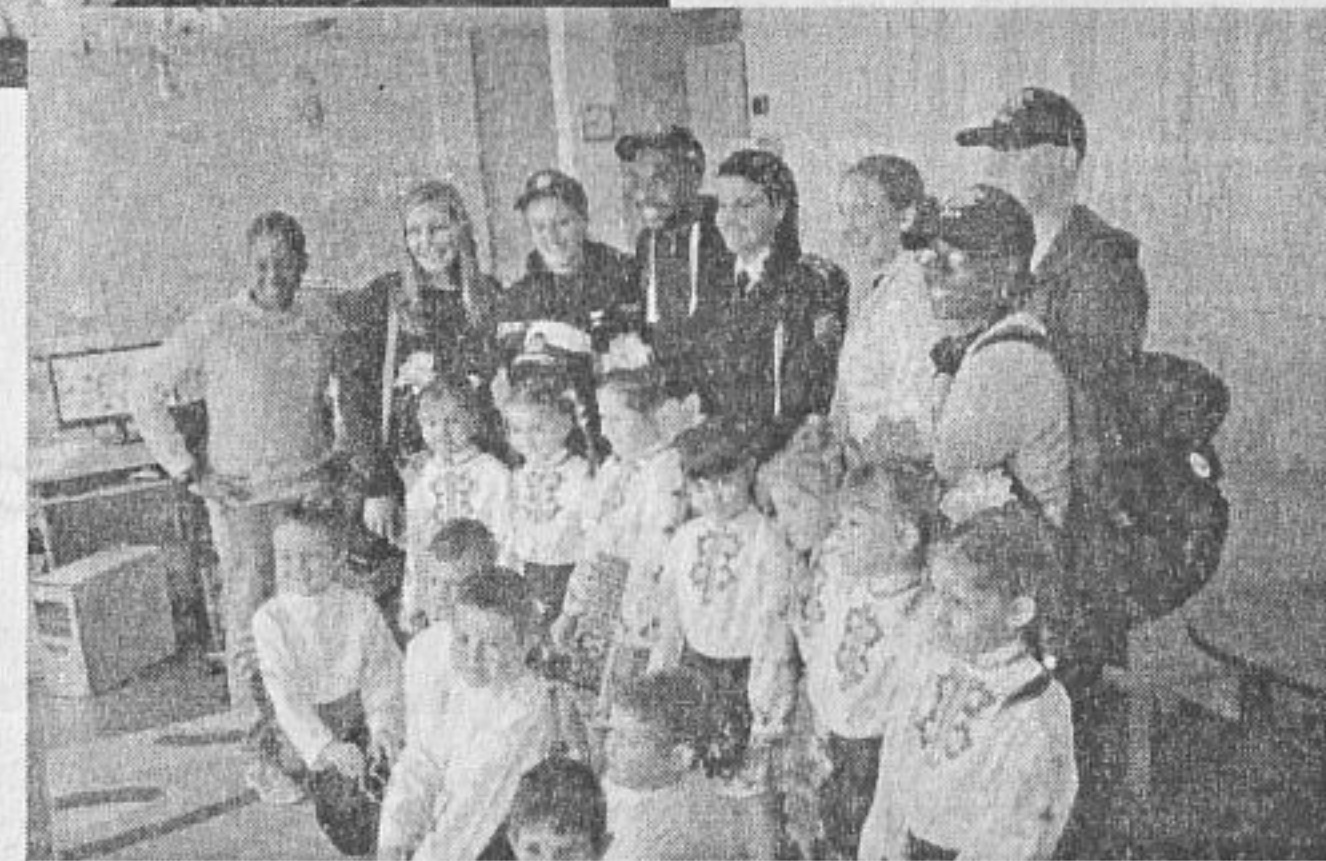
Всички заедно и щастливи

Младите американски военни си направиха стотици снимки с прекрасните български деца, играха с тях с кукли и колички, танцуваха българско хоро. Защитата на тези достойни американски матроси осигуряваха