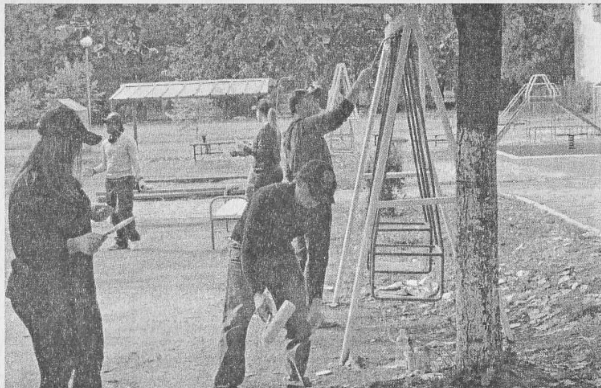
Боядисване на двора