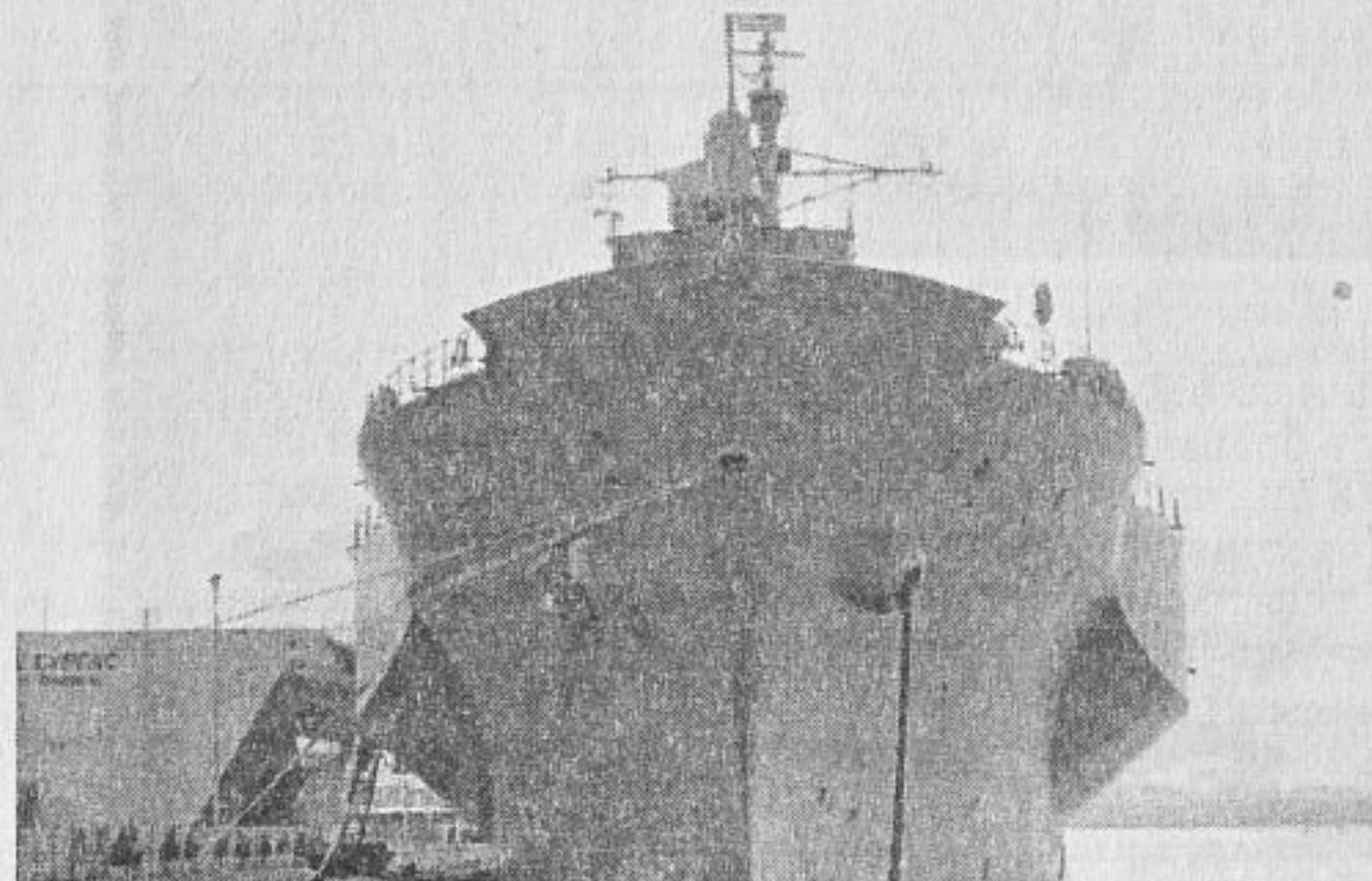
Флагманът "Маунт Уитни" на Морска гара-Бургас

Ярослав КОЮМДЖИЕВ Асоциация „Институт за научноизследователска и мониторингова дейност в регион Евразия“ - Бургас