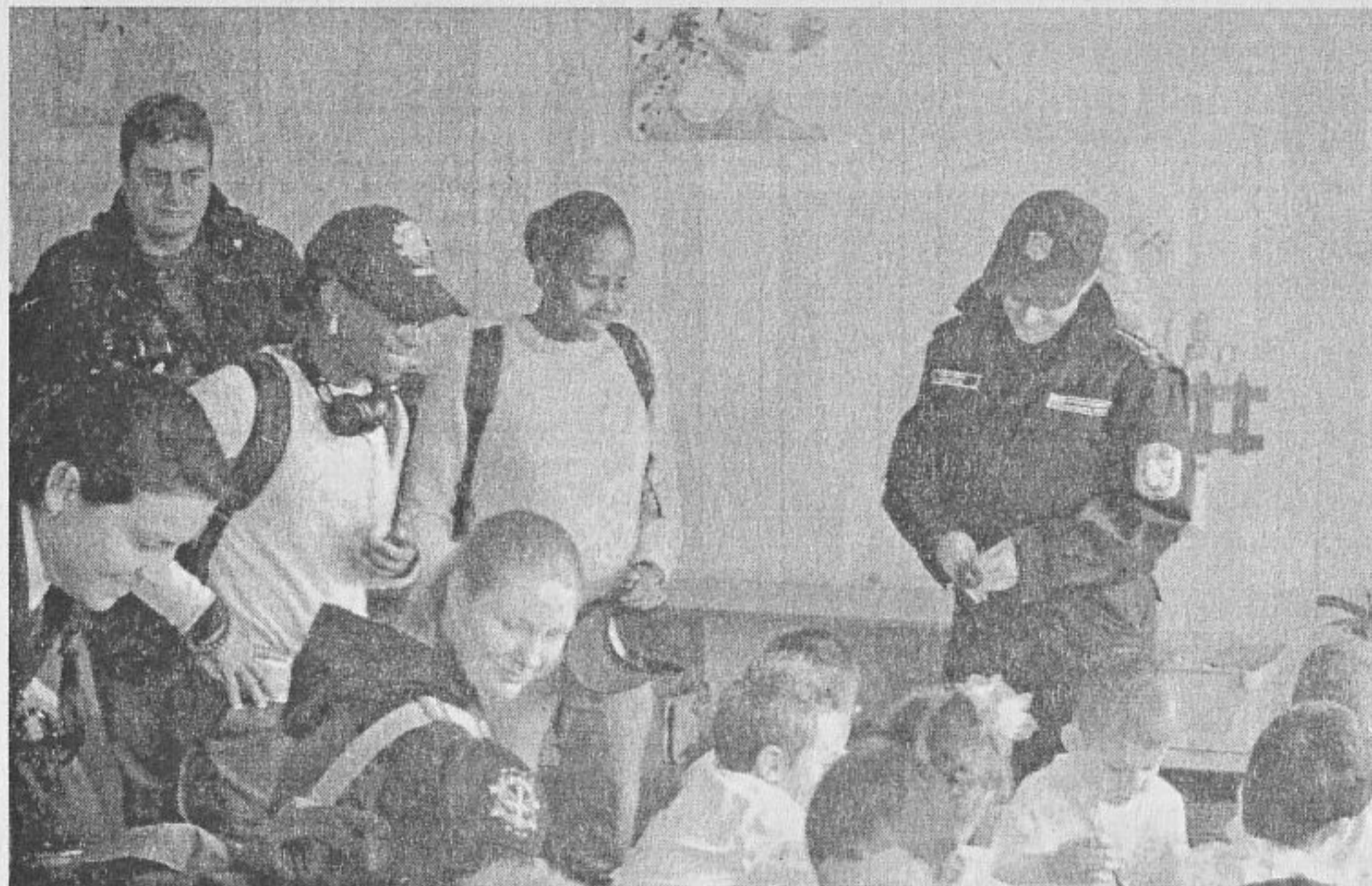
Американски матроси, бг военна полиция и журналисти с децата