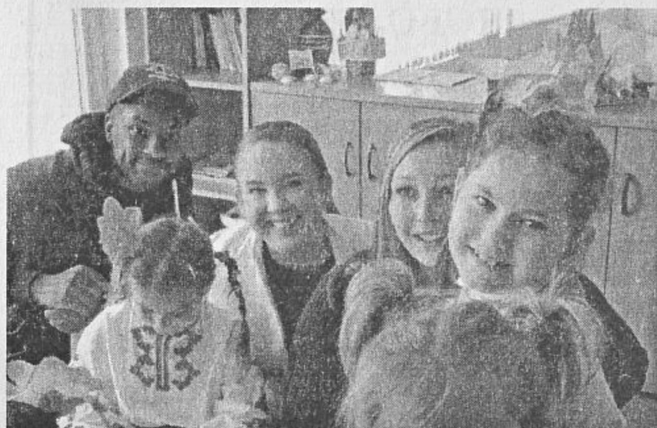
Слънчеви и щастливи - американски матрос и български деца