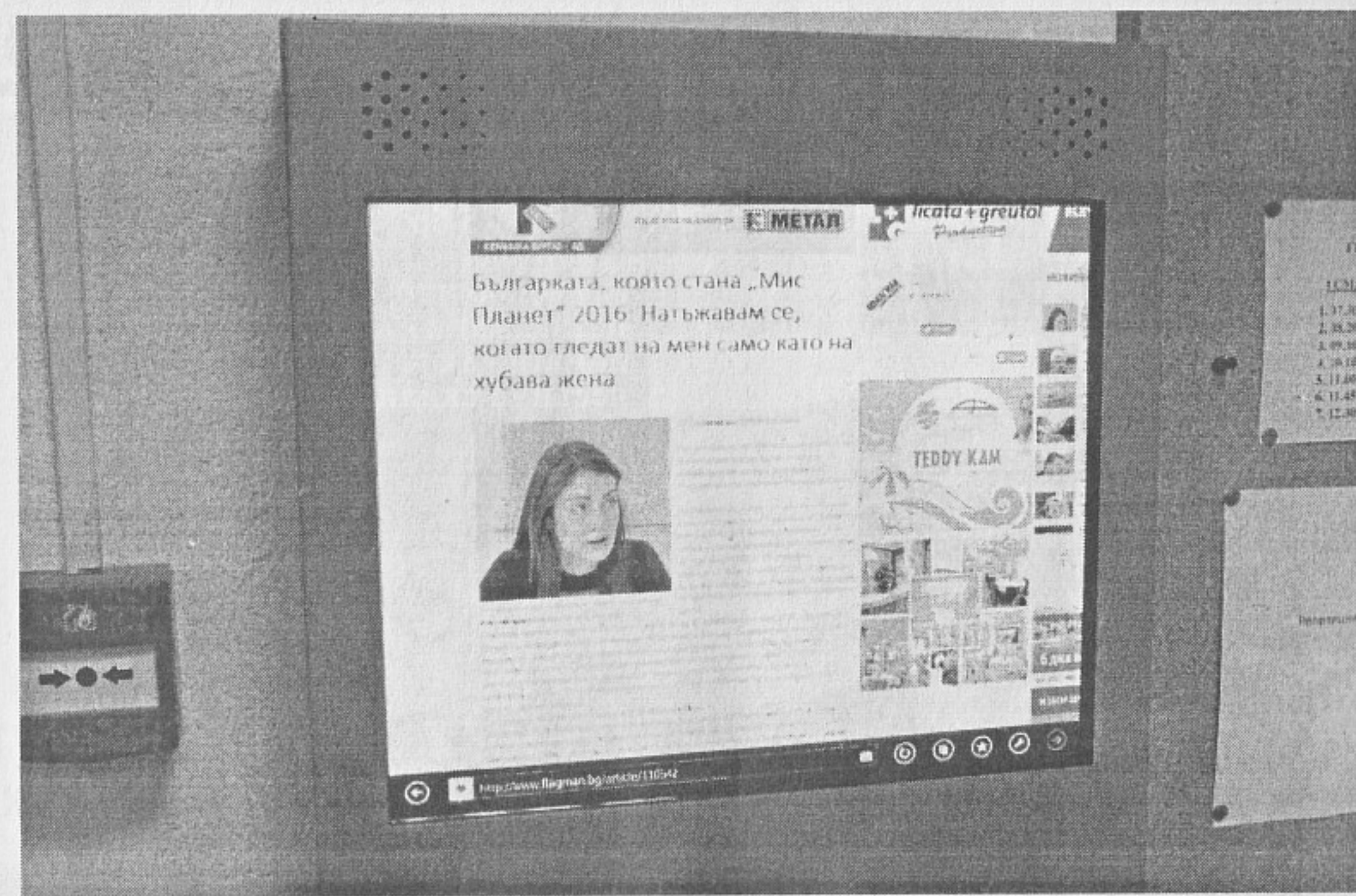
Електрониката е навсякъде в гимназията