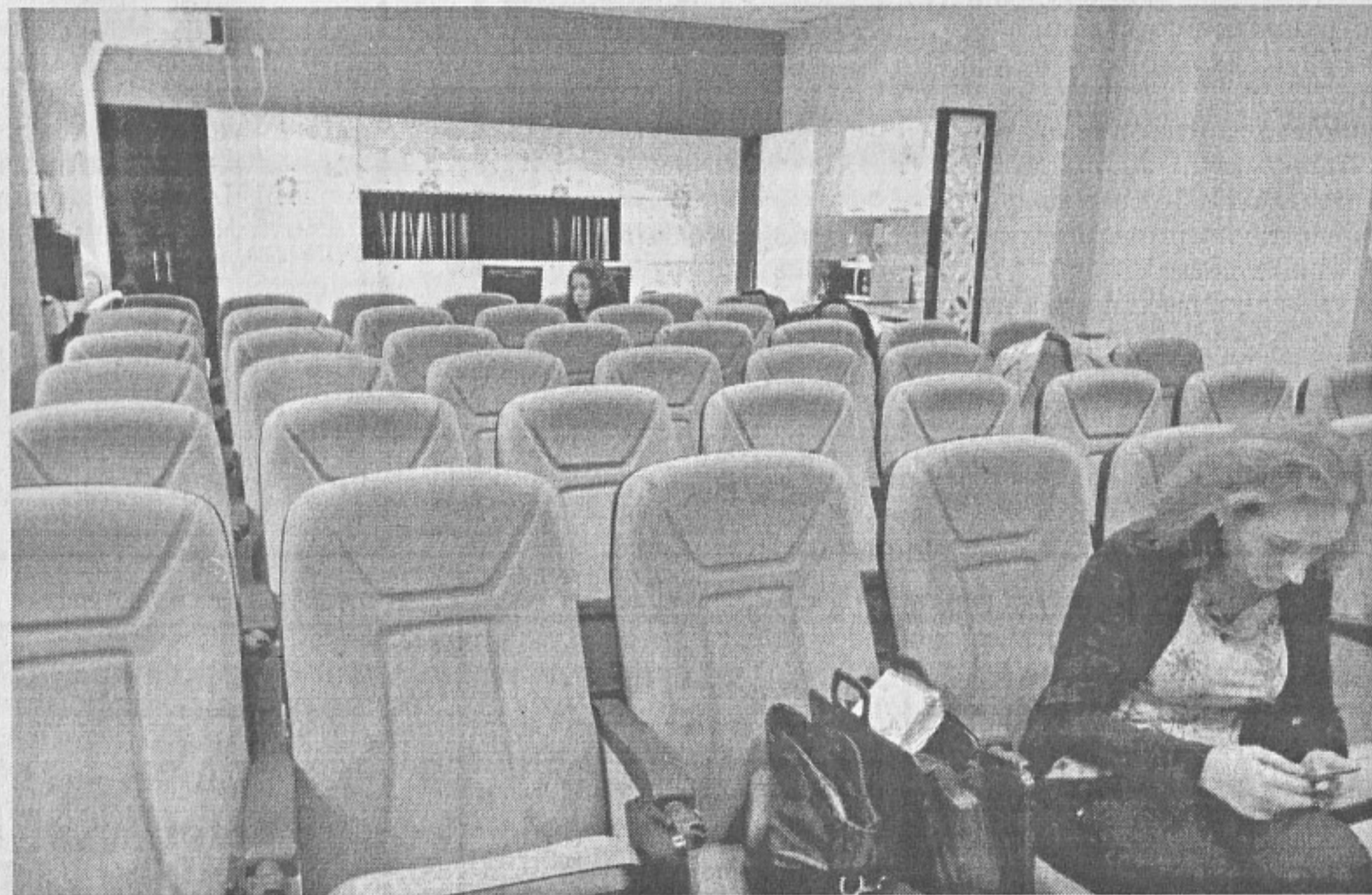
Учителската стая е супермодерна и иновативна и като визия, и като възможности

Хубавото на този проект е, че той се разтваря извън рамките на училището. Не само учителите могат да бъдат ръководители на кръжочните или на извънкласните форми, а и бизнесът. Всички съсловия на изкуството, на спорта могат, след като са заявили желание