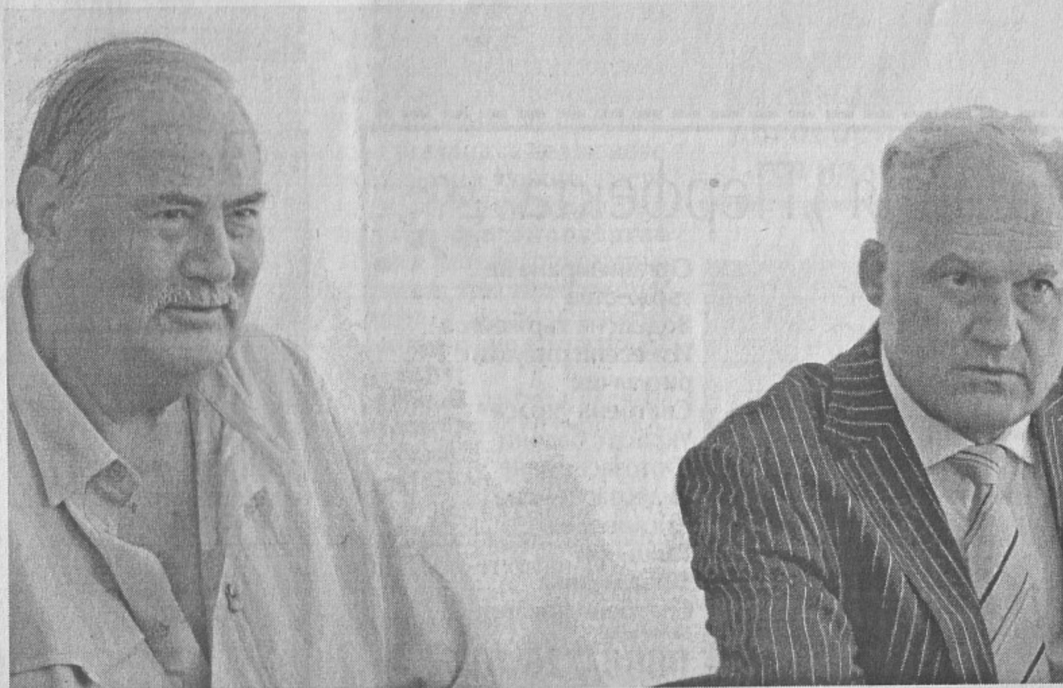
Кандидатпрезидентската двойка Жорж Ганчев и Кольо Парамов

Подобен разговор той имал и с бившия посланик на САЩ у нас Джеймс Уорлик. „Той ми е приятел, искаше да ми води кампанията. Написах му имейл: „не искам да ми помагаш, само не ми пречи“, обясни Жорж Ганчев и допълни, че никога не го е канил, а сам е решил да се кандидатира за прези-