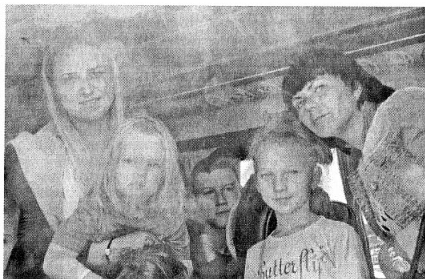
На Летище Бургас