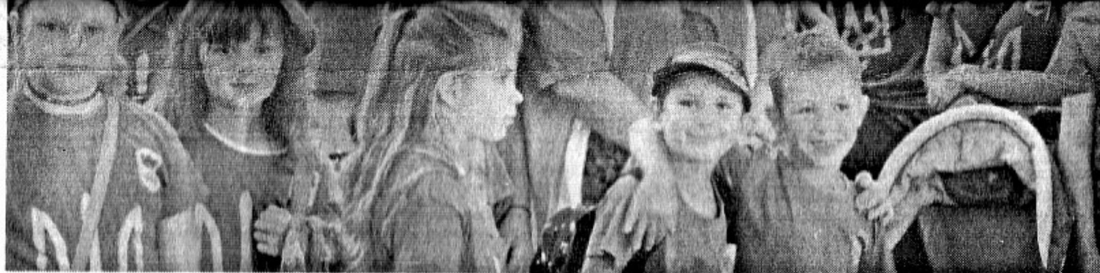
На Летище Бургас

ставители на украинската общност в града и други видни бургаски граждани.