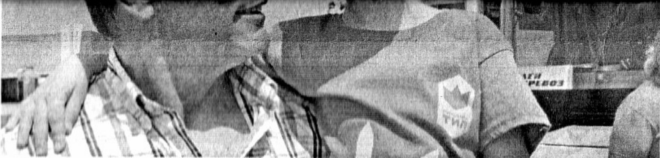
Почетният консул на Украйна в Бургас Д.Караненов с украинско дете в ръце