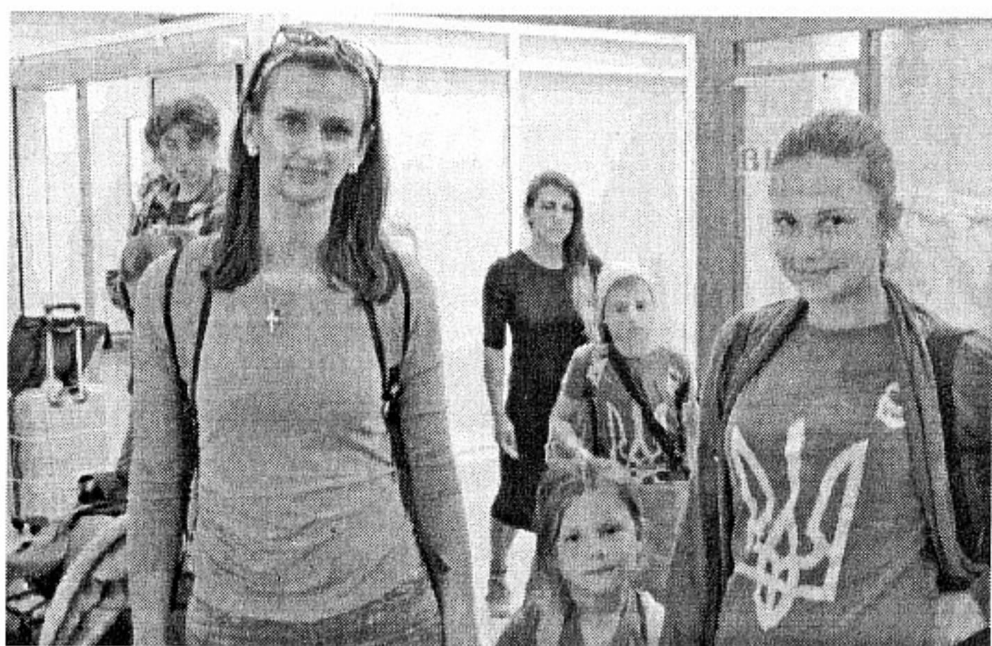
На Летище Бургас

Следва. Ярослав КОЮМДЖИЕВ Асоциация „Институт за научноизследователска и мониторингова дейност в регион Евразия“ - Бургас