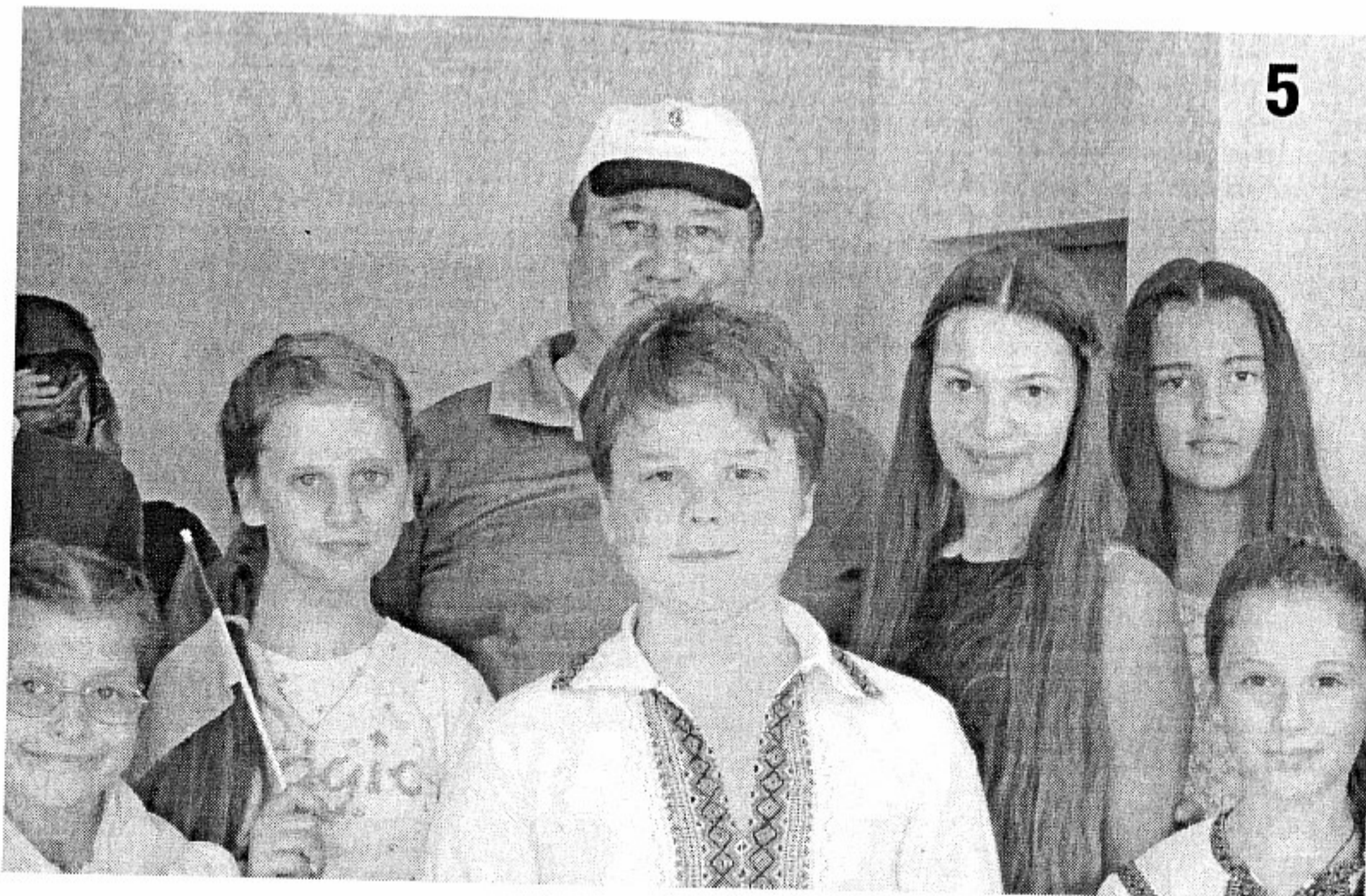
децата беше вече договорено за сметка на приемащата страна (тоест нашите

Следва. Ярослав КОЮМДЖИЕВ Асоциация “Институт за научноизследователска и мониторингова дейност в регион Евразия” - Бургас