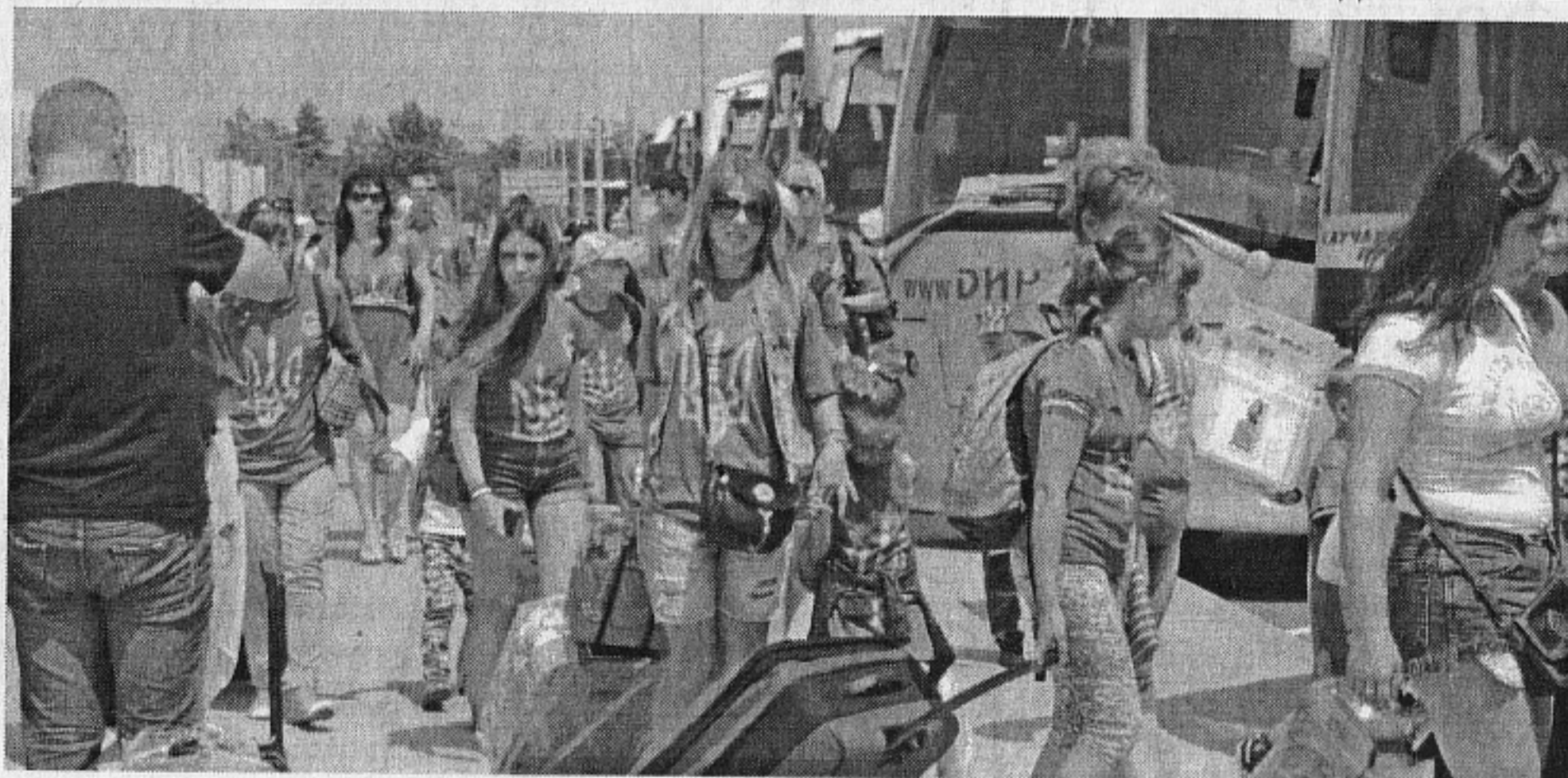
Украинските деца на път за Свети Влас

И биха могли да го взривят сами, бих казал аз (Ярослав Коюмджиев), основавайки се на 7-годишния си опит от територията на Чечня и Дагестан - средногодишно там се провеждаха официално по 200 терористични акта или