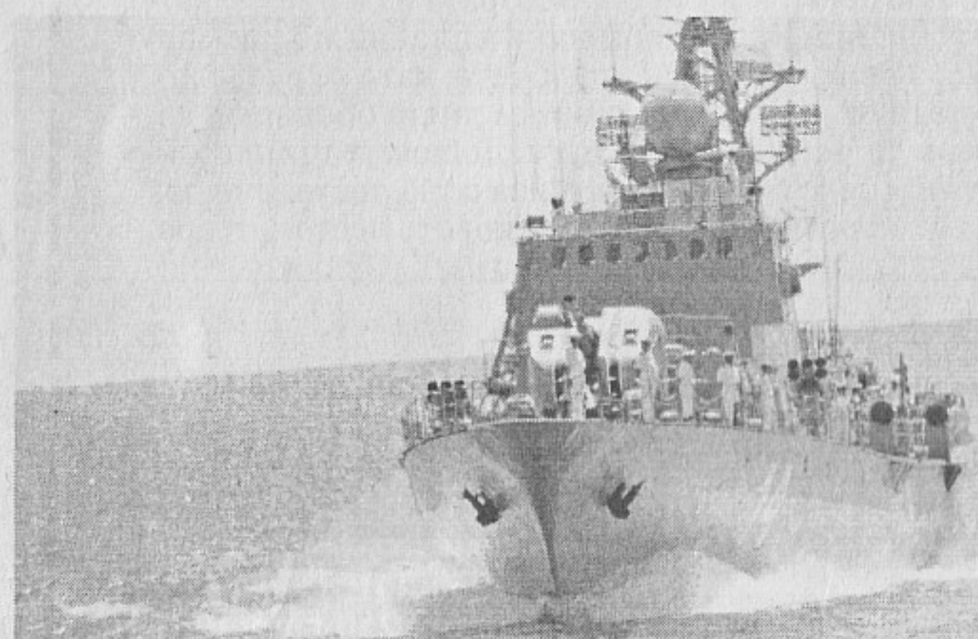
Българската торпедна корвета „Бодри“

ционални и не конвенционални хибридни заплахи. Видяхте, че държим ръка на пулса на времето и професионализмът на българските военни моряци гарантира на България защита на морския ѝ суверенитет“.