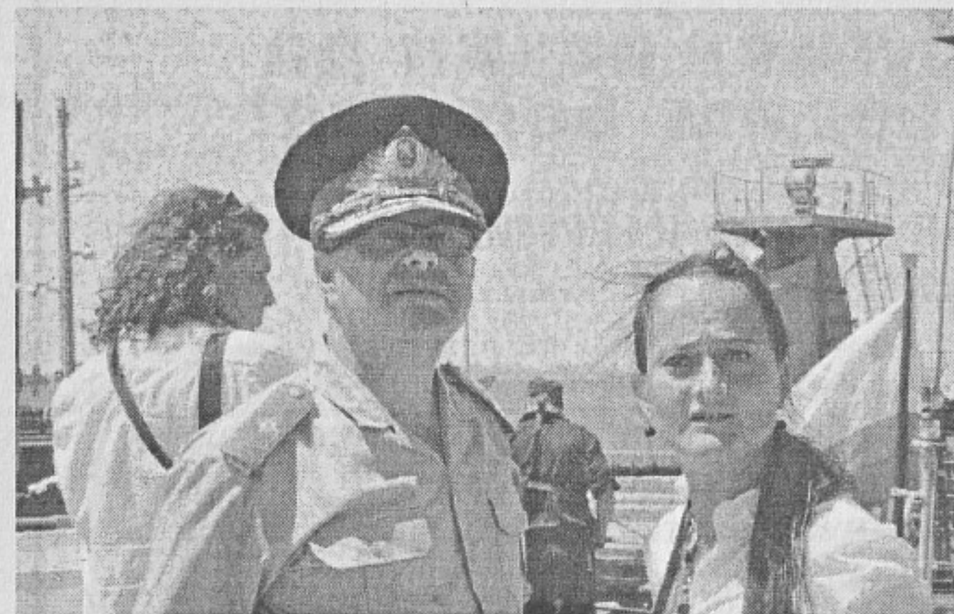
Военна полиция и пресслужба към МО