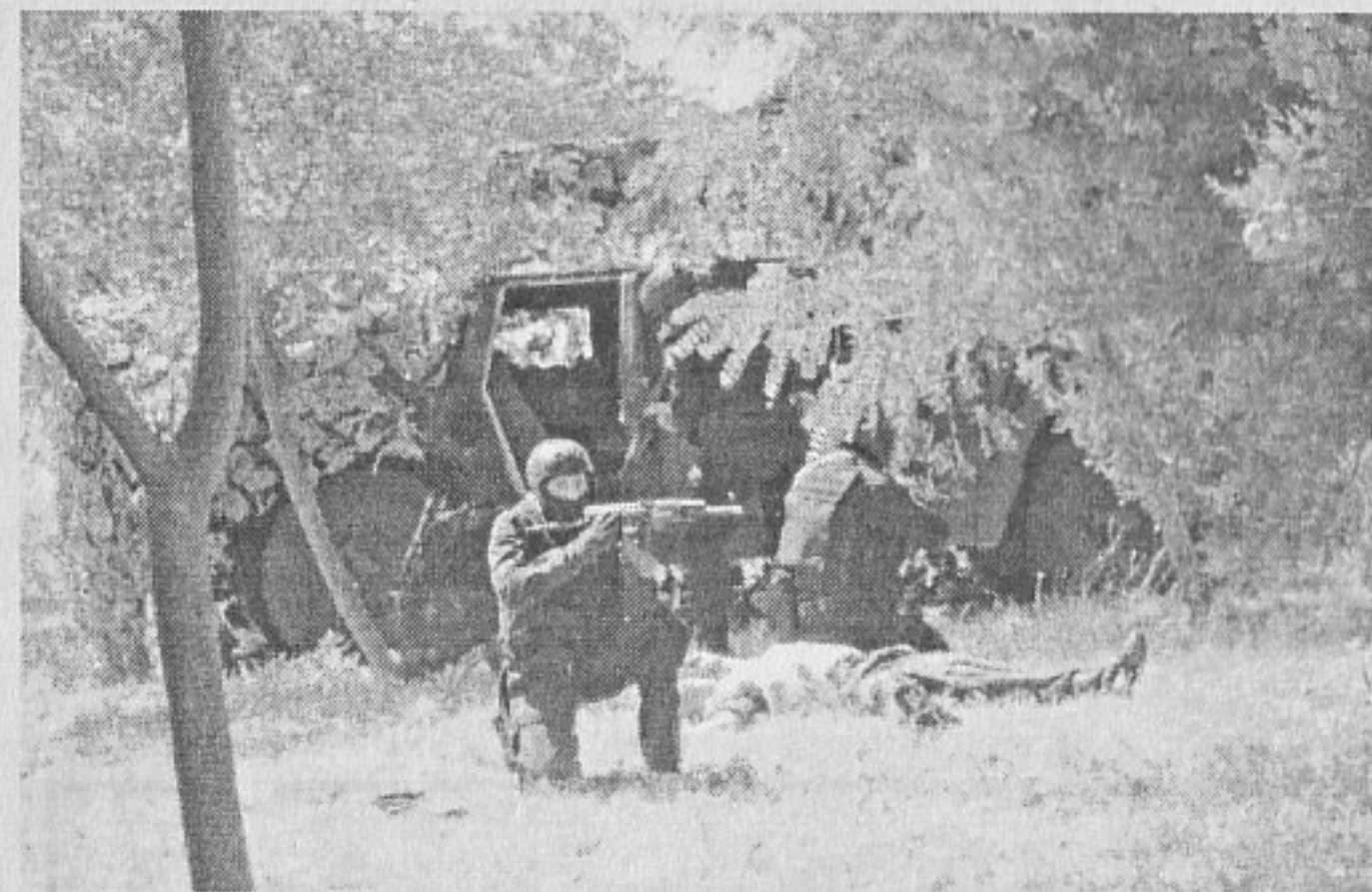
На брега в базата

Ярослав Коюмджиев Асоциация „Институт за научноизследователска и мониторингова дейност в регион Евразия“ - Бургас