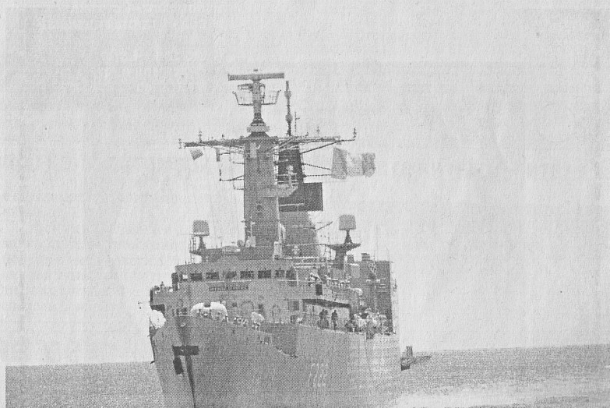
Румънската фрегата „Регина Мария“

завърши в брегови условия. Фрегата 42 „Верни“ акостира в Пункт за базиране Бургас и на брега на десантния полигон ВИП гостите и медиите наблюдаваха последния и най-комплексен епизод на учението - „Овлавяване на наблюдателен пост на паравоенно формиране“ (Сн.6.). Групи от МСРО с 2 бързоходни лодки бяха спуснати от кораба за управление и скрито подходи-ха към крайбрежието, на което е разположен пункта на обявена за терористична организация. В това време в зоната влетяха 2 вертоле-