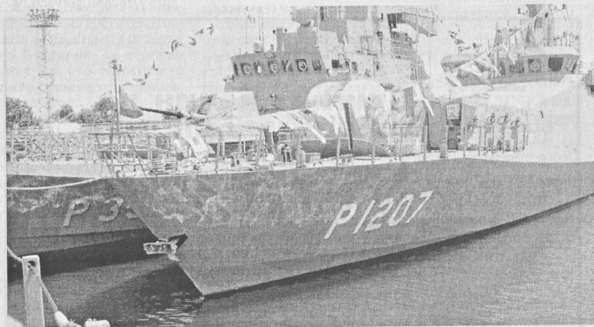
Турските ракетен катер АТАК и патрулен катер TEKIRDAG