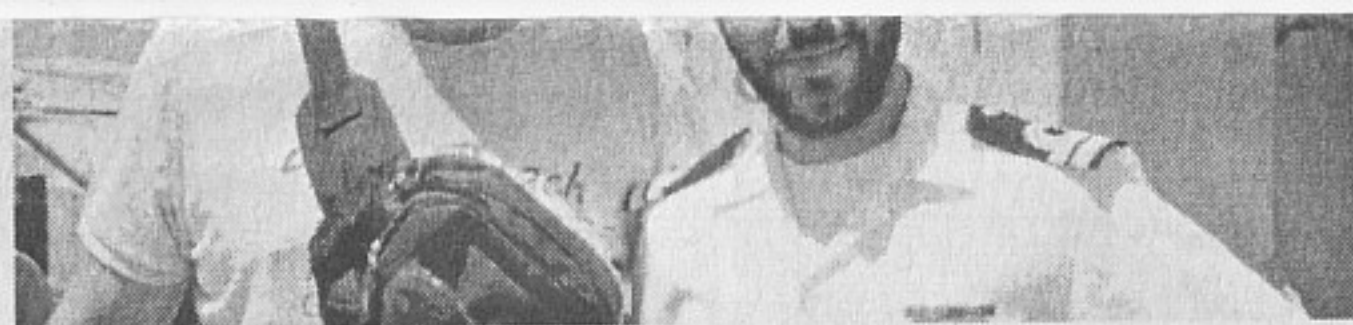
Гръцки офицер и бургазлия на най-тежко въоръжения гръцки катер „Григорулопос“

Основната идея на „Бриз“ е да се повиши оперативната съвместимост и взаимодействието между военноморските сили на участващите страни чрез отработване участието им в операция в отговор на