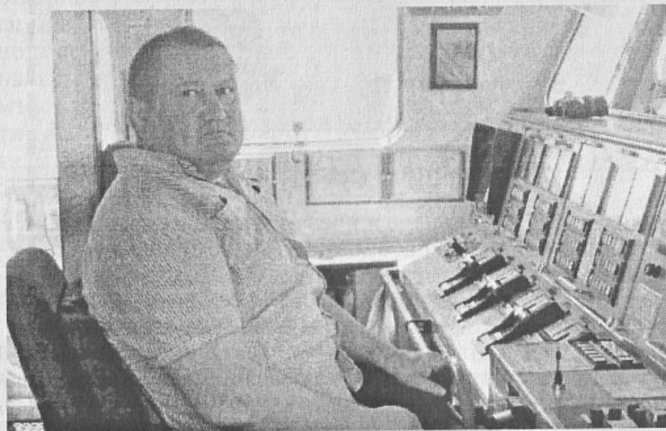
С удоволствие управлявам турския ракетен катер АТАК

Ярослав КОЮМДЖИЕВ Асоциация „Институт за научноизследователска и мониторингова дейност в регион Евразия“ - Бургас