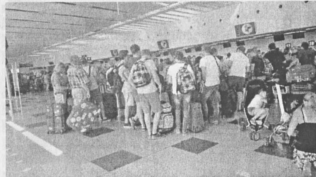
Не дай си боже някой терорист - идиот се гръмне сред стотиците туристи