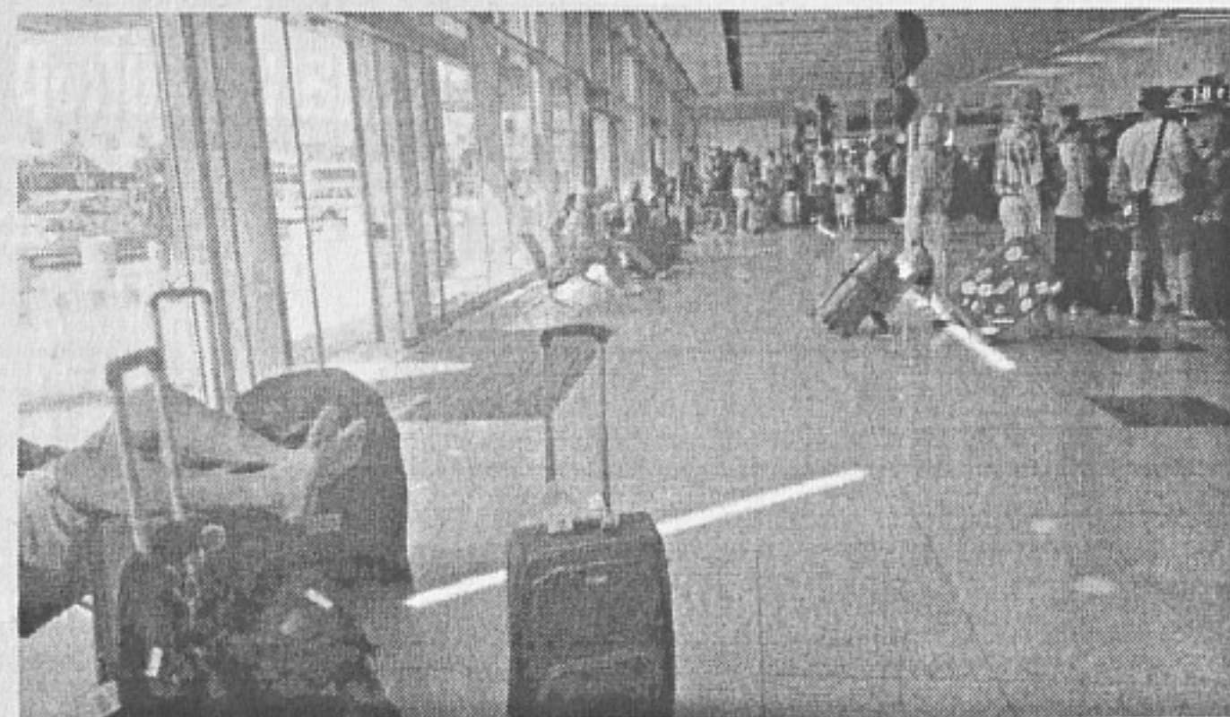
Входове на Летище Бургас без контрол със скенери

Клубът "Нощни вълци" е създаден по време на управлението на Борис Елцин, през 1989 година. Имат устав, в който изрично се забраняват хулигански действия, бандитизъм, наркомания... "Нощни вълци" подкрепят финансово и морално ветераните от войната, военните и децата от домовете. Вместо да засадят дърво, но истинско и високо поне 2-3 метра, те засаждат едно почти еднометрово дървено клонче (шлипка по народному), което струва стотинки по разсадниците. Мисля, че е по-добре да се