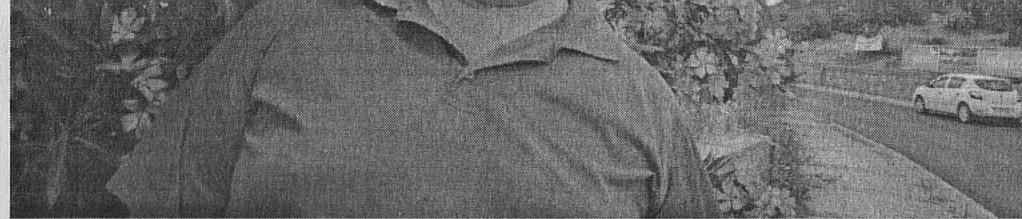
Море от зокум

го интелигентни и образовани, знаейки освен родния турски, и английски и руски езици, но те не бяха с автомати, а и дори да имаха оръжие, то не се забелязваше. Като началника на жандармерията в провинция Узункюпрю, област Одрин. Но така е решило нашето Министерство на туризма да си измие ръцете - така е