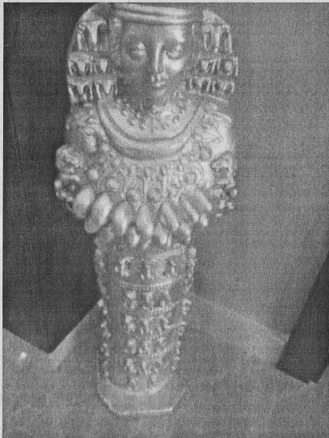
Статуята на Артемида