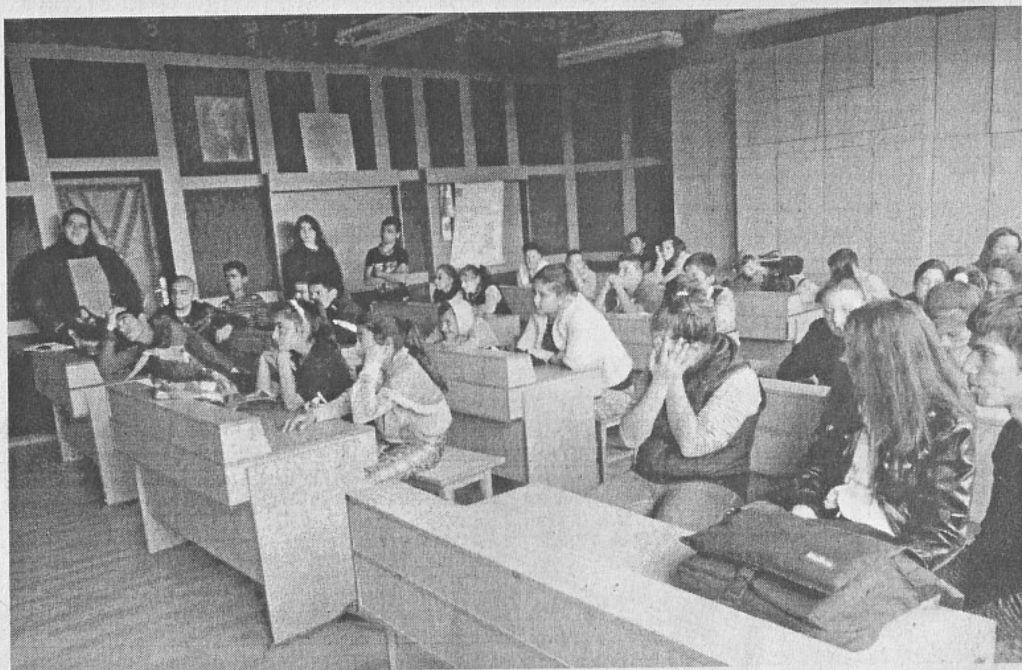
Най-голямата зала на училището трудно събира 40 кадети за занятие