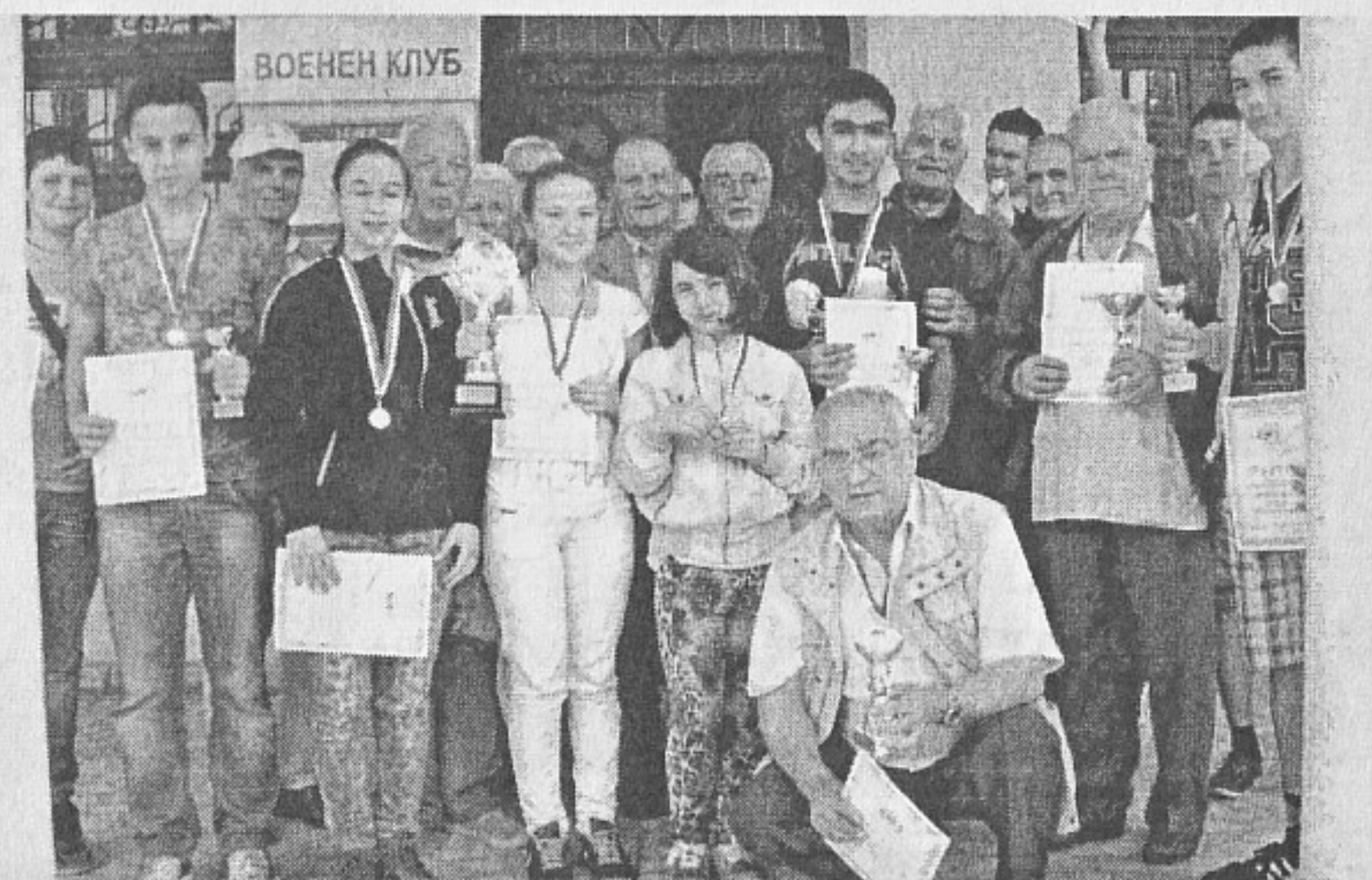
Млади и възрастни шахматисти заедно