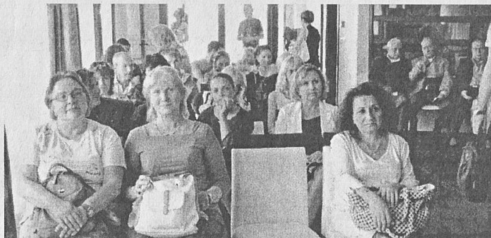
Щастливи в България

След встъпителните думи част от ръководителите от Съюза на офицерите и сержантите от запаса и резерва в Бургаска област в лицето на