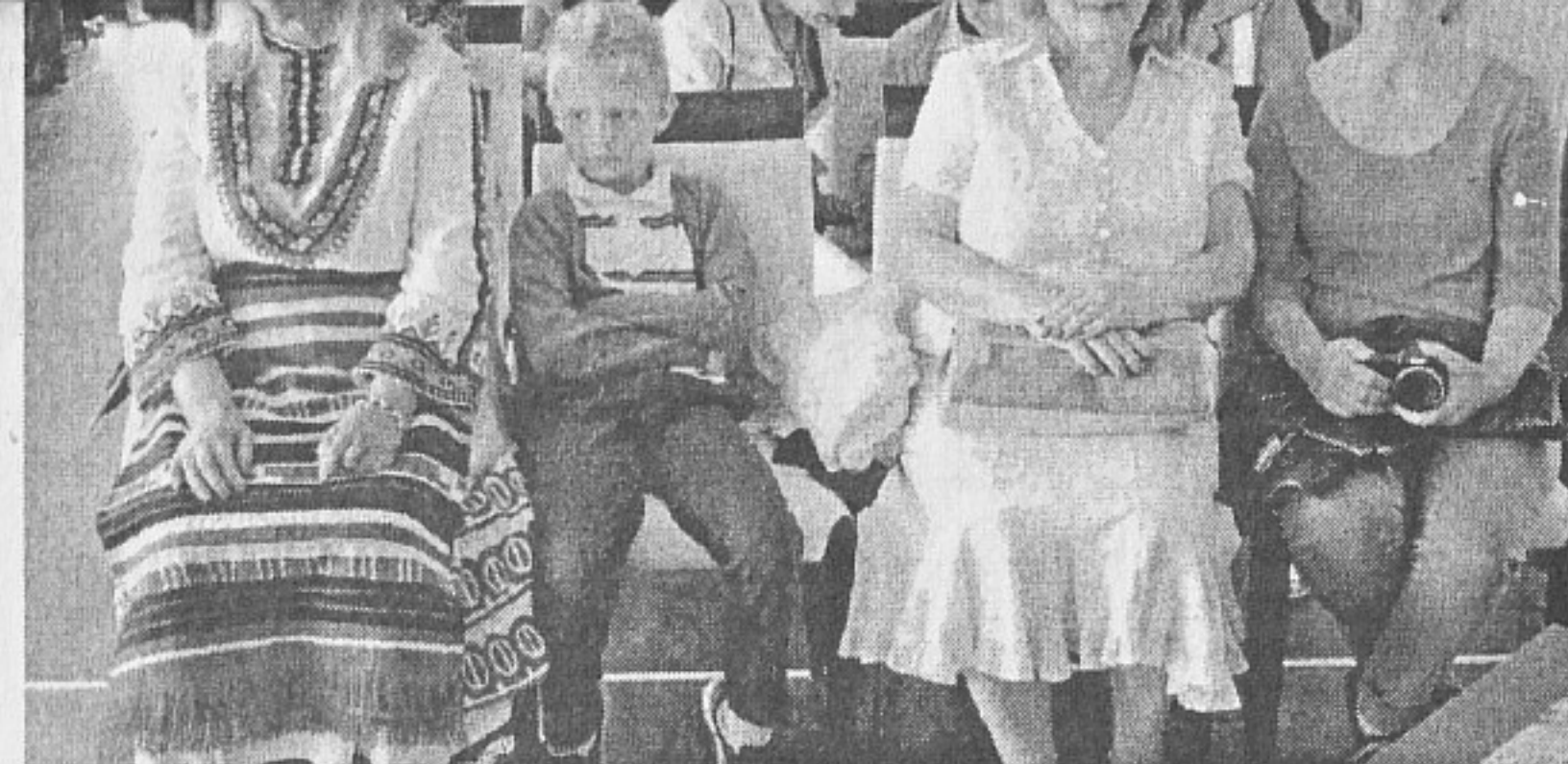
Имигрантите с удоволствие носят български носии

Чужденците с разрешения за продължително пребиваване са концентрирани главно в столицата и големите градове на страната, като над 30 % от тях живеят на територи-