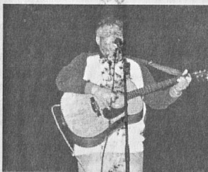
Дует „Страст“, Военен клуб - Айтос

Осем руски и едно българско дете пресъздадоха феерия от чувства, спомени за войната и гордост от победата. Ние помним и никога не трябва да забравяме тези, които са дали живота си за нашата свобода и победата над фашизма. Защото фашизмът в Европа надига глава в лицата на незаконно управляващите Украйна американски подлози. И избиват собствения си народ с жестокост, по-голяма от хитлеристката. Но за двуличието на САЩ и Евросъюза в следващите броеве. Сега нека се насладим на снимките от неповторимия празник-концерт по случай 9 май - Ден на победата над фашизма в Бургас.