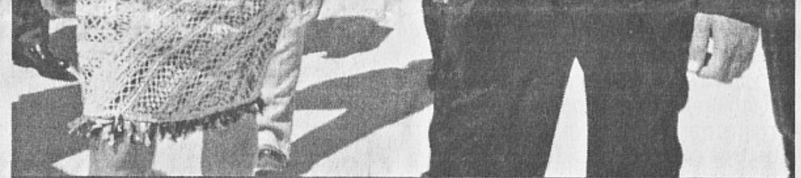
Башар и Асма Асад

Асад. Преди още един месец Вашингтон обеща на Ел Рияд (ръководството на Саудитска Арабия е заинтересовано от свалянето на правителството на Сирия и създаване на така наречения Арабски халифат) военна подкрепа в случай че