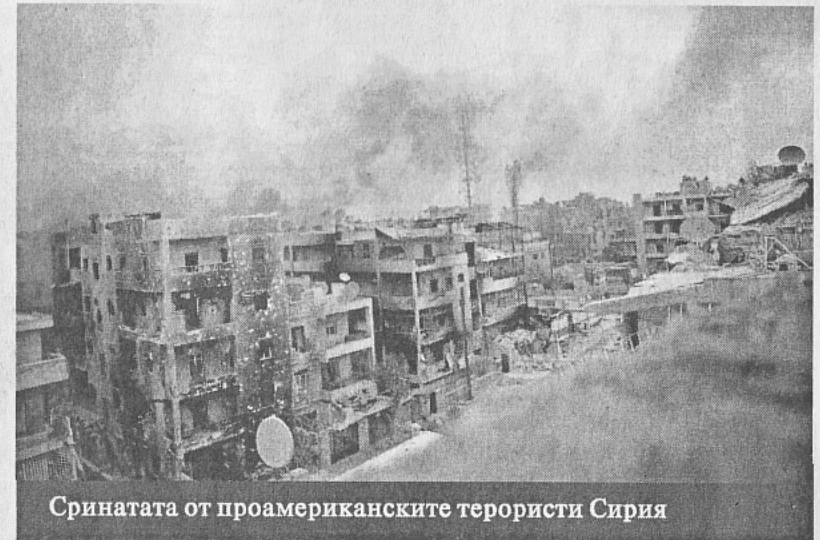
Сринатата от проамериканските терористи Сирия

наистина големи и непобедими исполина – РУСИЯ и КИТАЙ. Защото както преди бях писал за диверсификацията на петролния износ на Иран в страни, които не биха позволили смяната на ръководството чрез война в Иран от САЩ и Израел, така и президентът на Сирия разпредели новото нефто-газово находище в Средиземно море между Сирия, Русия и Китай. И въртящите се като гладни кученца около това находище Кипър, САЩ, Англия и Израел останаха с пръст в уста. Да си го хапят от яд или смучат в глупаво умиление както решат. А тези 300 милиарда евро ще отидат за възстановяването на Сирия от нейните два истински приятели и съюзници – Русия и САЩ. И това младо и красиво семейство на Башар и Асма Асад ще продължат да пазят мира в Близкия изток и християнските светини. А ние (държавничес-