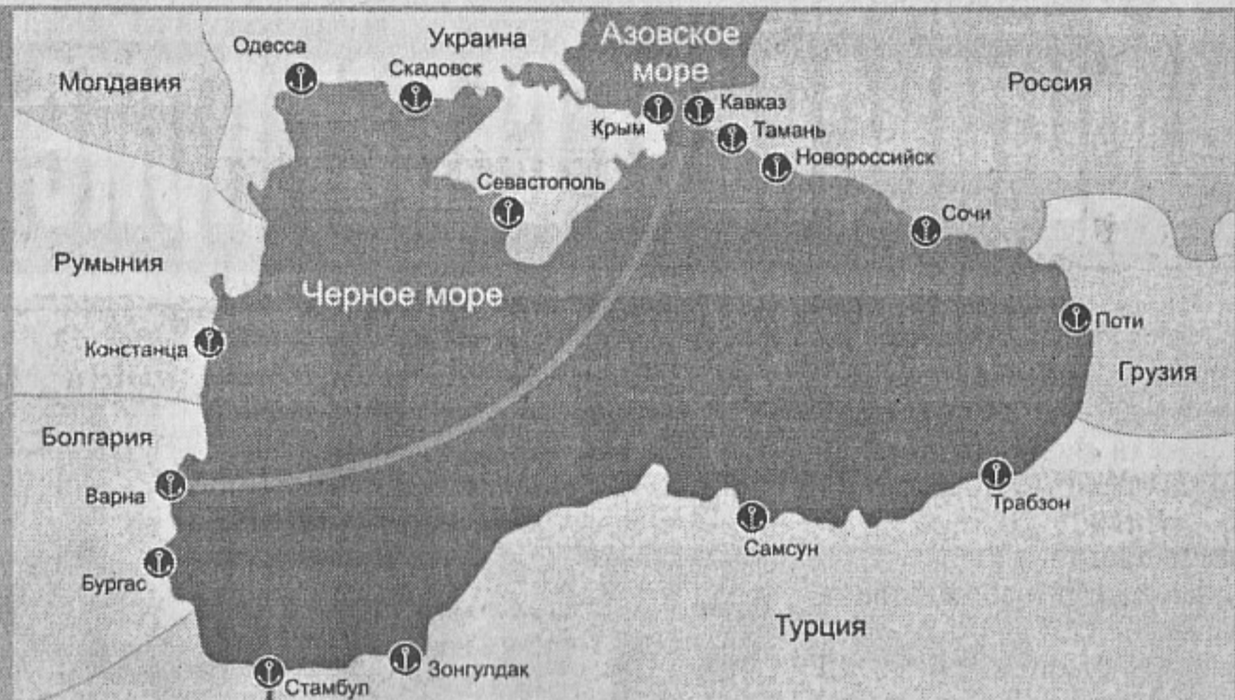
Линията Порт - Кавказ - Варна