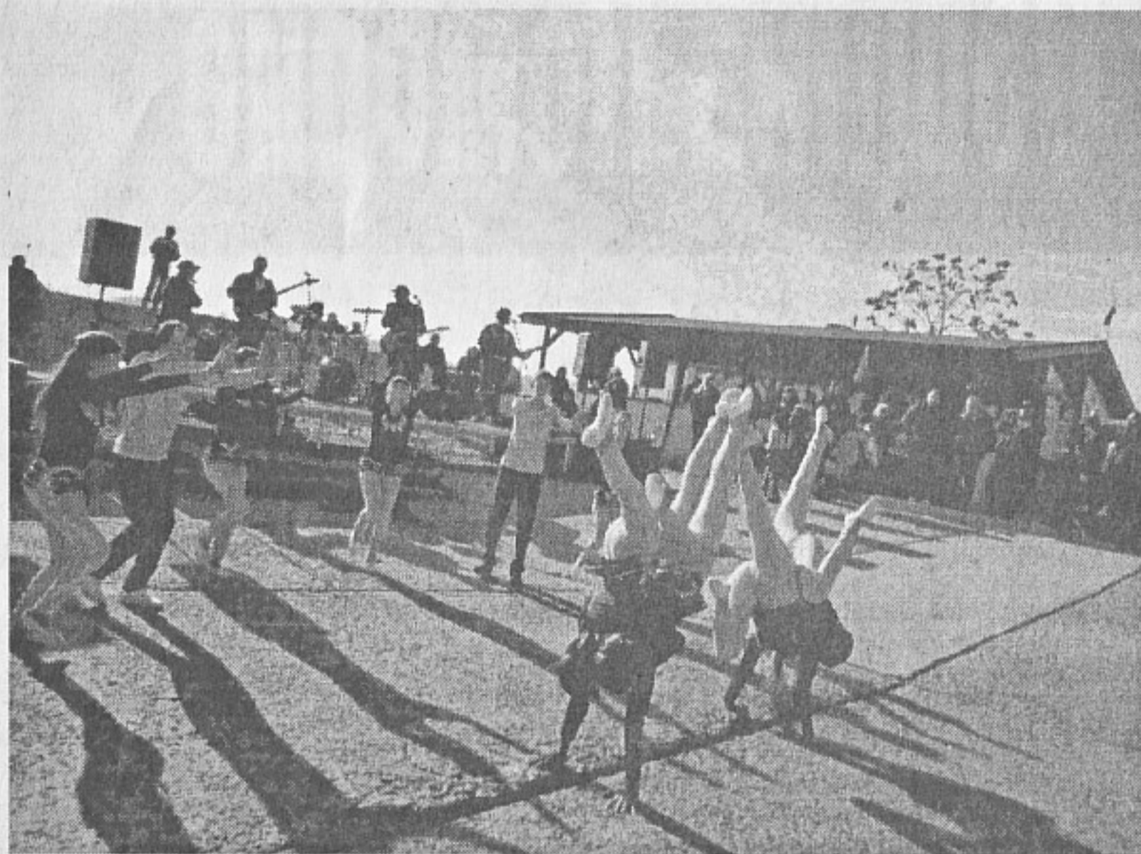
6 декември. Концертни програми от състави на ВК - Айтос по случай празника на гр. Царево