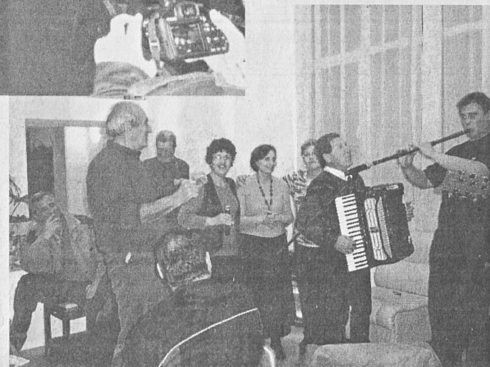
5 декември. Концертни програми от състави на ВК - Айтос по случай празника на гр. Царево

С двудневна програма съставите на ВК - Айтос зарадваха членовете на военно родолюбивите съюзи и гражданите на гр. Царево по случай празника на града - Никулден. На 5 декември от 18ч. във ВК - Царево бе изнесена специална програма за членове на СОСЗР, военно-родо-