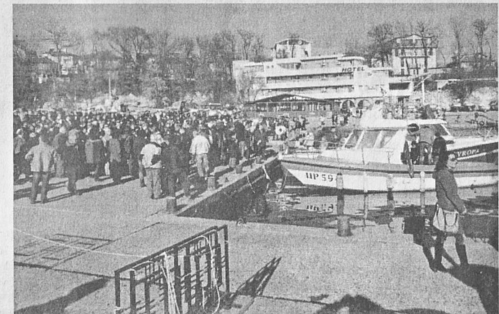
Военен клуб - Царево организатор и участник в тържествата по случай Никулден