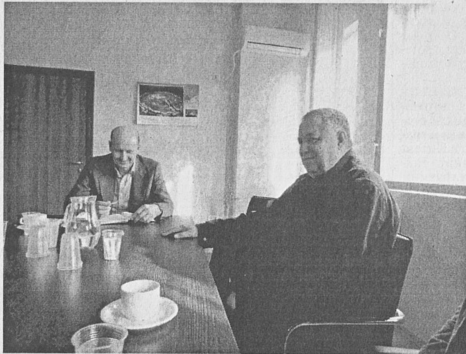
Полк.о.р. Никодим Стоянов с бриг. ген.о.р. Васил Джебелов, - Зам. обл. председател и общински председател на СОСЗР-Бургас

- С това завършвам първото си интервю с полк.о.р. Никодим Стоянов - началник на отдел „Югоизточен“ към Министерството на отбраната. Защото с интелигентен, образован и достоен човек като него винаги има какво да се говори и какво да се научи. А в следващия брой на вестника очаквайте интервю с още един достоен българин и бургазлия по местоживееене - роденият в град Марица генерал-лейтенант о.р. Гиньо Тонев. Съвсем наскоро, на 6 декември, заместник командващият на Генералния щаб на БА от 2000 г. навършва 70 години с един достойно извървян път - 41 години в служба на българската армия и България.