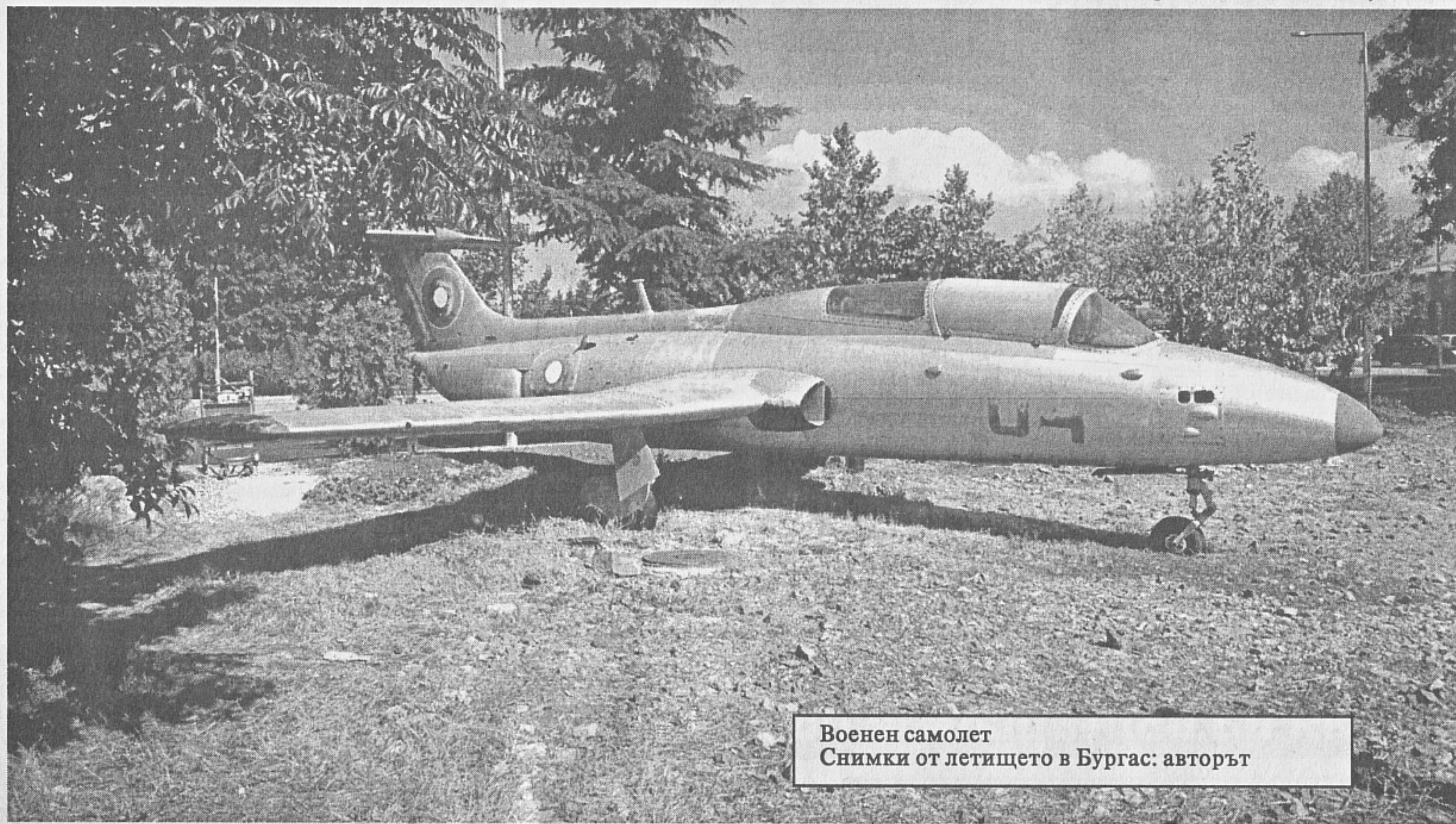
Военен самолет Снимки от летището в Бургас: авторът

На 16 октомври 2013 г. беше почетена паметта на българските летци, загинали във войните и при изпълнение на служебния