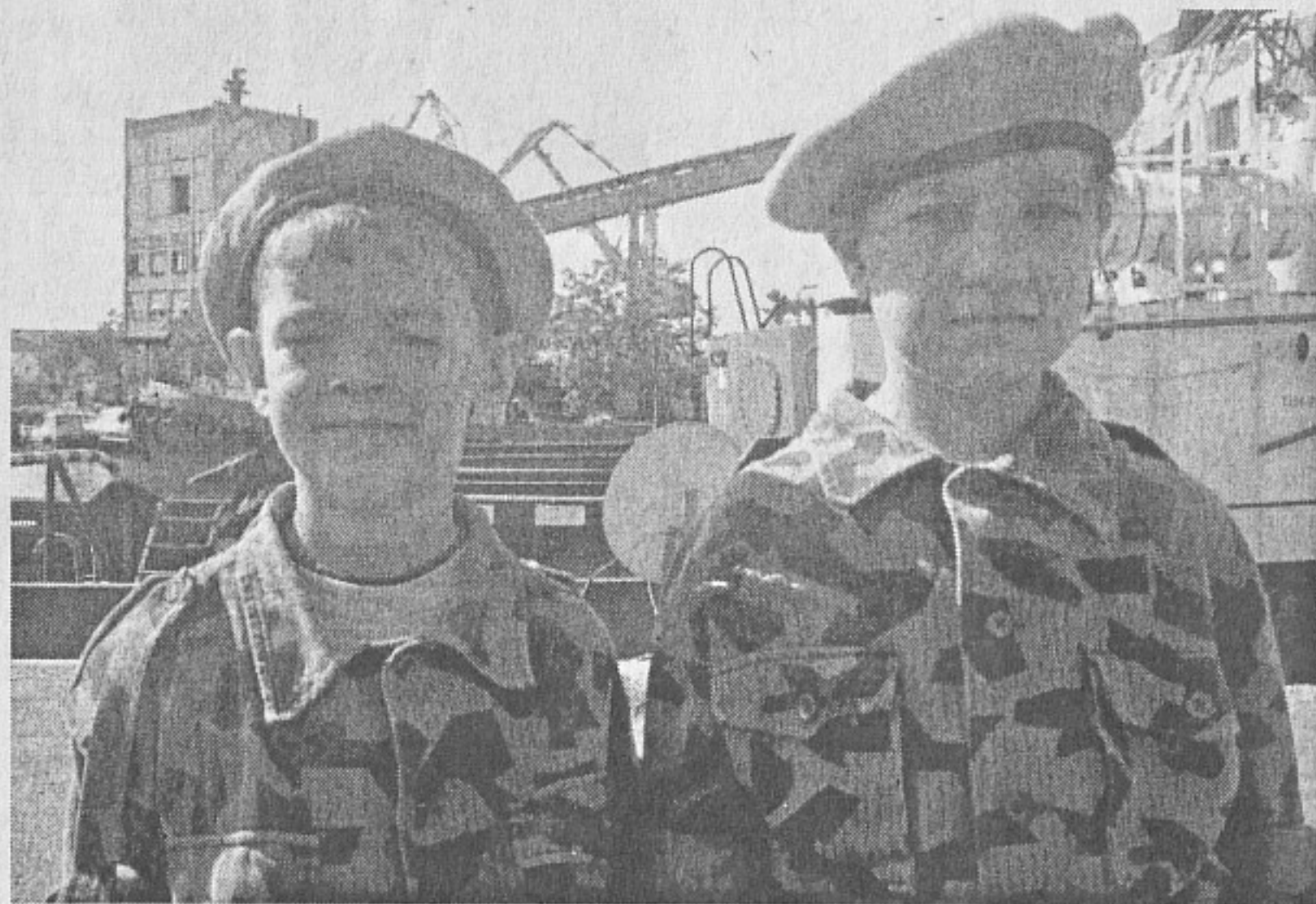
Най-младите 7 и 8-годишни