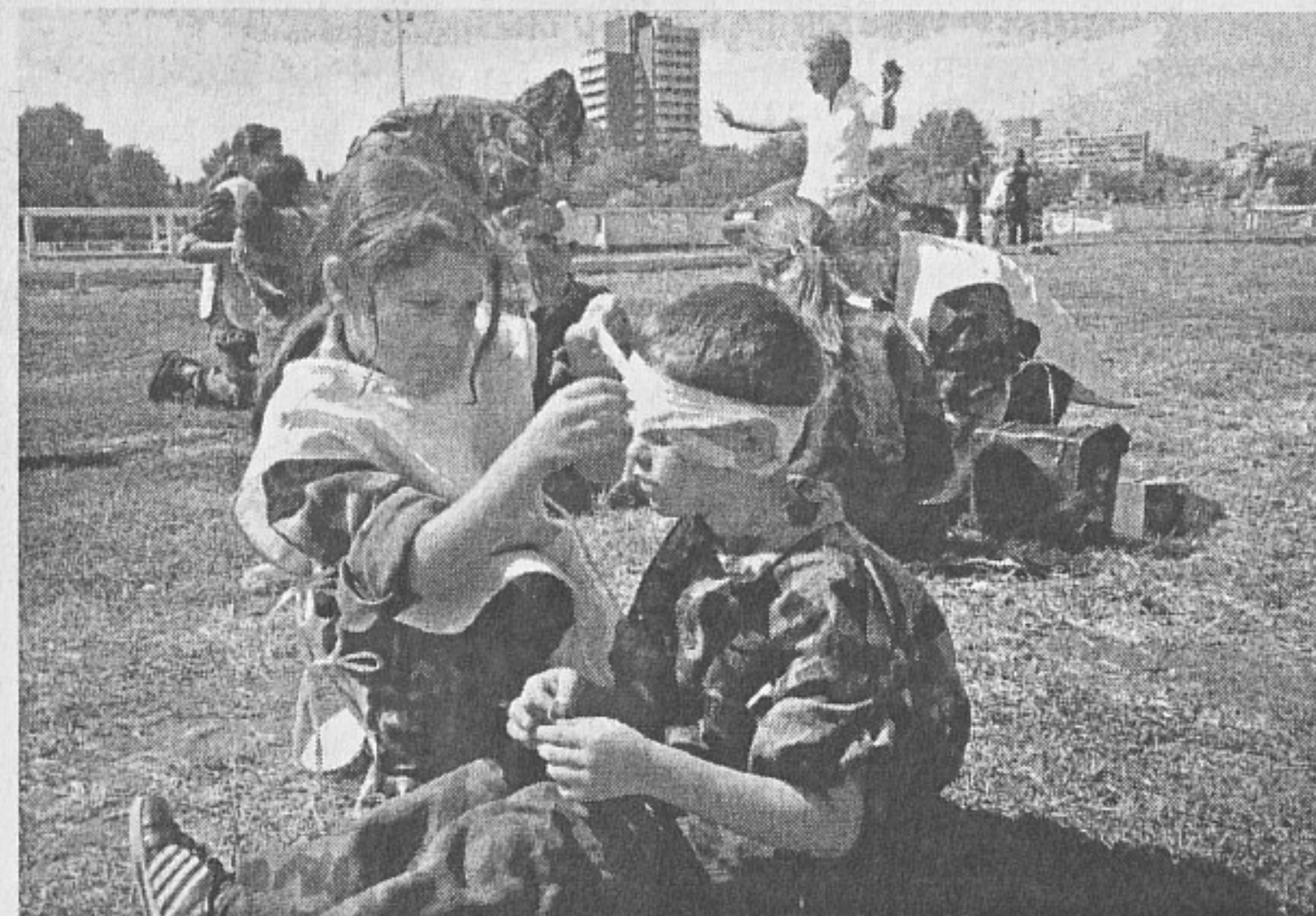
Превръзката едвам става за 8-годишните