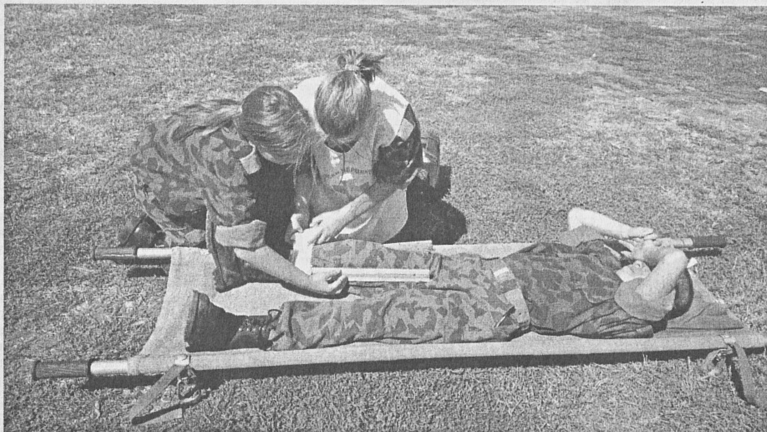
Деца оказват първа помощ на дете

спортни клубове и др. Програмата предвижда базисно обучение в основните раздели на две основни и две по-високи нива на специализация. Работи се предимно в извънкласни форми, но отделни занятия се провеждат и в учебната задължителна програма. Самостоятелно и в съвместна дейност с институции се изпълняват редица подпрограми като „Лична творческа лаборатория“, „България - кръстопът на цивилизацията“ и други.