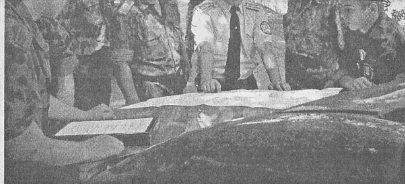
Русе с гранична полиция-ученически батальон

Лично командирът на формирането проведе занятията по инженерна подготовка на тема - „Минната война в локалните военни конфликти“. На нея учениците бяха запознати с различните видове мини на въоръжение в армиите, начините за миниране на полета, техниката и правилата за обезвреждането и преодоляването им, както и с инженерната техника за преодоляване на различни водни препятствия.