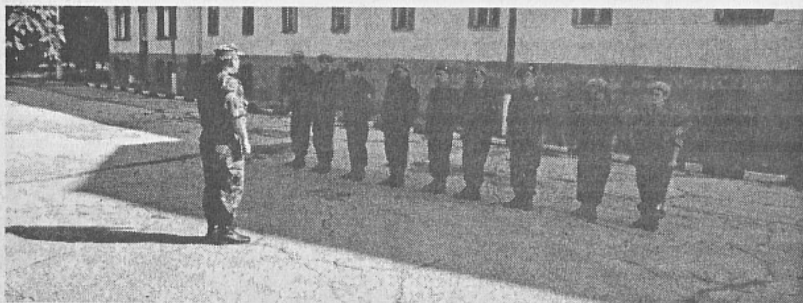
Ученически батальон във ВФ-Русе