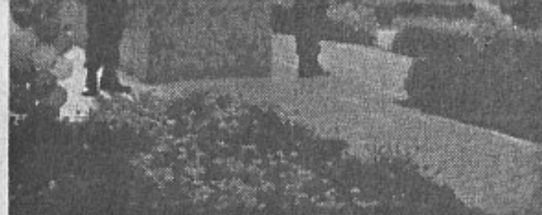
Ученическият батальон на караул

зам.-командира на формирането Пламен Петков, където получи знания по физическа подготовка, устава, техническа подготовка, тактическа подготовка, тактика и принципи - подготовка на водещия занятието на други.