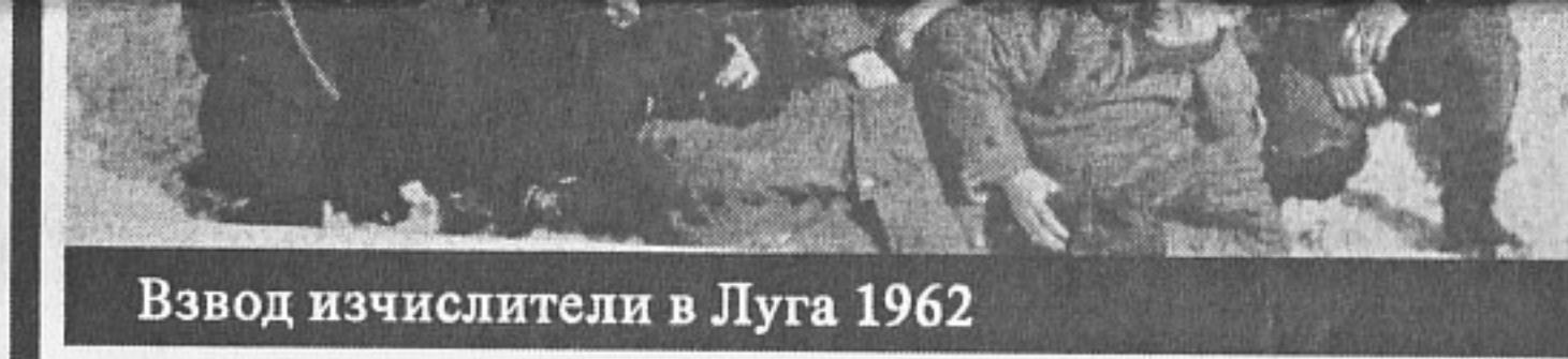
Взвод изчислители в Луга 1962

Бях произведен от младши сержант в сержант и октомври 1961 г. стъпихме на съветска земя. Бяхме 8 българи – двама изчислители, двама метеоролози, двама топографи и двама пусковици (командир на отделения пускова обстановка). На обучение в СССР по същите специалности бяха и