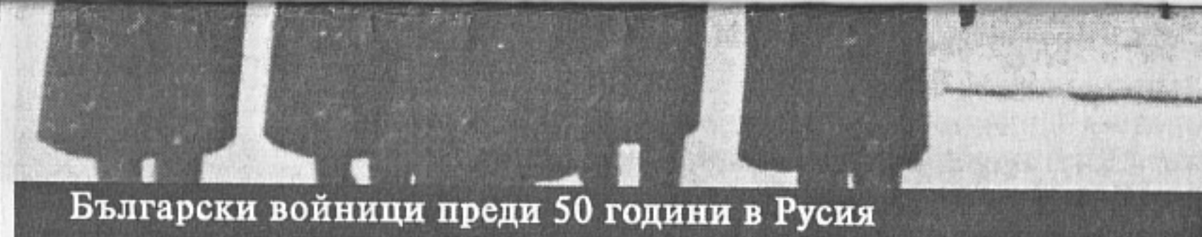
Български войници преди 50 години в Русия

След едногодишна подготовка личният и командният състав на седми ракетен дивизион на село Бояново показа отлични резултати по бойната и политическа подготовка. При положени изпити пред командването на Трета армия ни беше разрешено да произведем първия пуск на тактическа ракета във Варшавския договор и