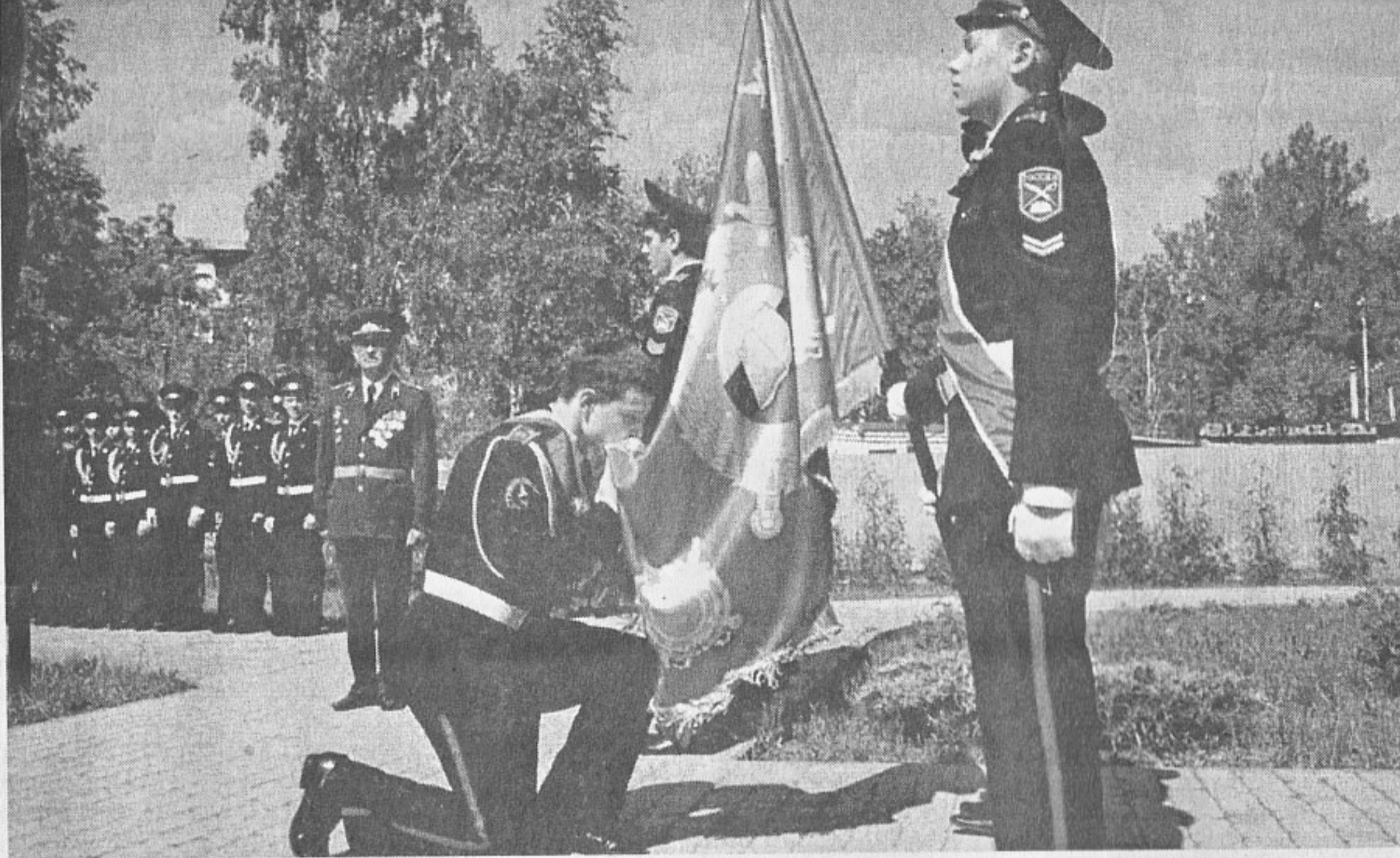
Руски кадет целува знаме

само... Но и силата на духа на младото детско сърце, което от сега знае, че честта е най-скъпото нещо и не се отдава на никого! Капитан I ранг Георги Георгиев е вече на достолепната възраст от 80 години, но е готов да сподели най-приятните си спомени от кадетските си години във Варна. А това е златно съкровище за нашата нова програма за възстановяване на "кадетството" в България. Този прекрасен военен със своя житейски път на преподавател в Средното морско училище в Бургас и Висшето военноморско училище във Варна е златно съкровище за възпитаване на нашето младо поколение в патриотизъм и военно дело. Последните почти десет години от стажа си капитан Георгиев е флагмански механик във Военноморската база в Бургас /Атия/ и под вещото си методическо ръководство обучава десетки корабни механици за Родната ни. Ние бихме били горди, ако след години обучаваните от екипа ни и капитан Георгиев младежи и девойки със същата или по-голяма гордост биха целували българското кадетско знаме, както виждаме да целува руското кадетско знаме младият руски кадет.