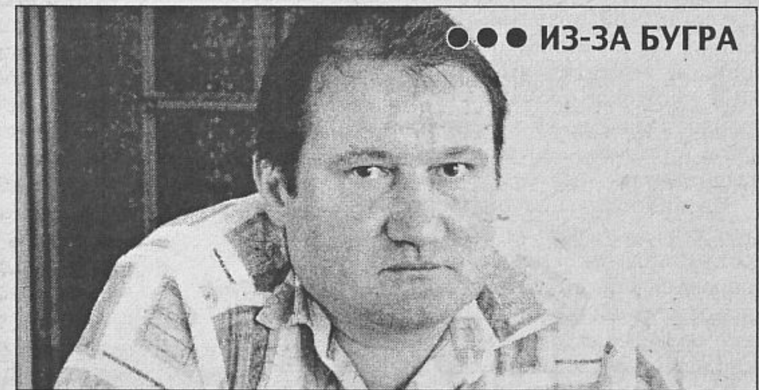
●●● ИЗ-ЗА БУГРА

Нужно отметить, что в отличие от некоторых европейских государств, которые сегодня обвиняют Россию, как правопреемницу СССР, в преступлениях периода Великой Отечественной войны, Болгария остается при своем мнении: она и тогда не отправляла своих солдат воевать