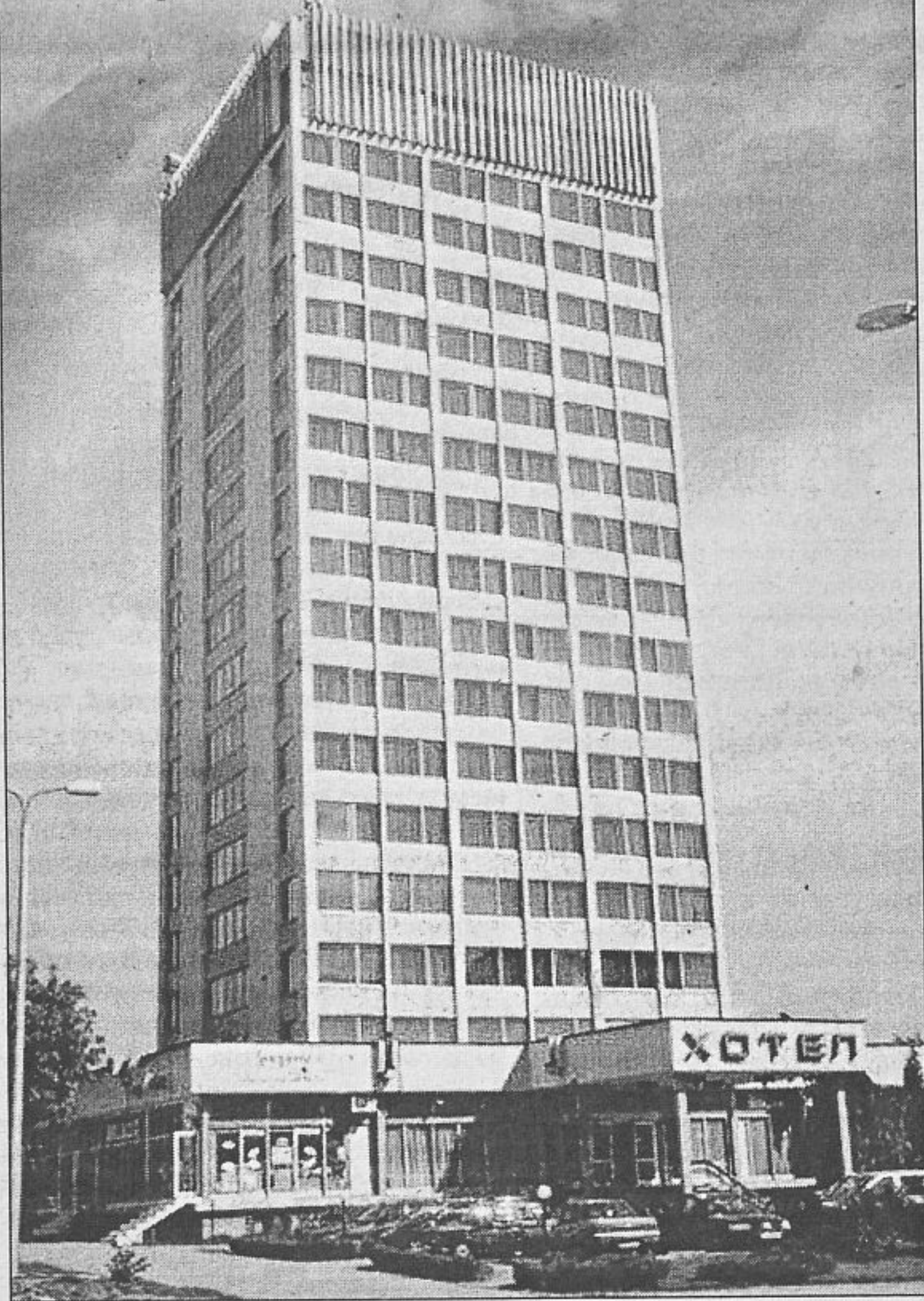
Отель города Сливен

В этом же году был подписан протокол о намерениях совместной деятельности ОАО «Даг-энерго» и Республики Болгария. В рамках этого протокола было предусмотрено внедрение в сельской местности специальных многотарифных счетчиков электричества, которые позволят уменьшить расходы населения за пользование элек-